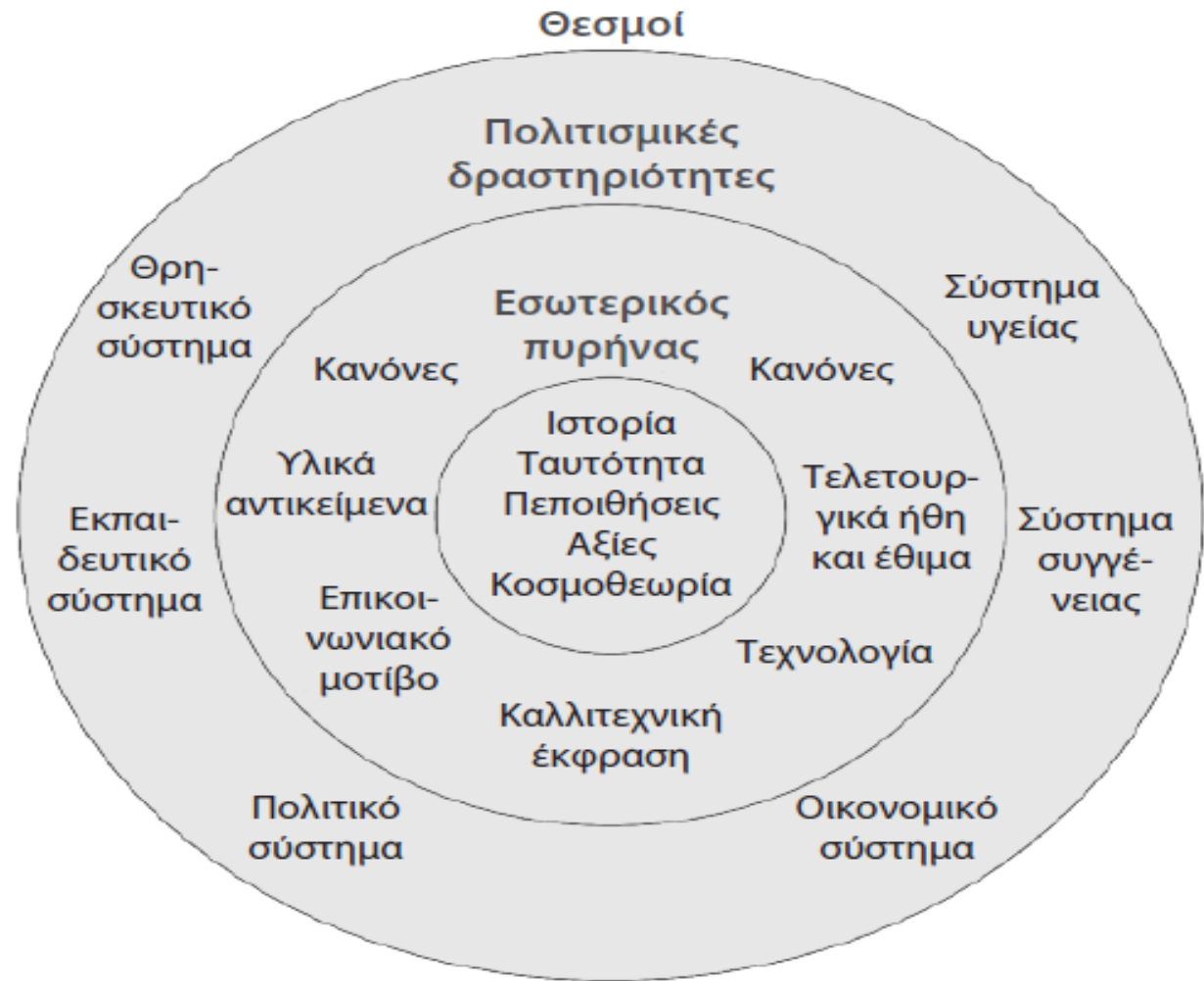
Σχήμα 3.1 Ένα μοντέλο του πολιτισμού.