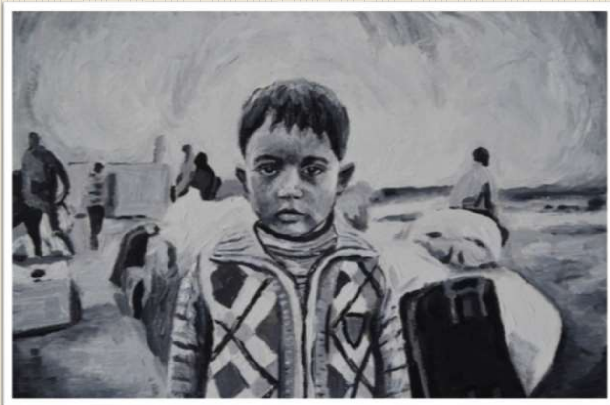
Πίνακας: Hannah Rose Thomas, «Syrian refugees»

«Κανένας δεν αφήνει την πατρίδα του, εκτός κι αν πατρίδα είναι το στόμα ενός καρχαρία. Τρέχεις προς τα σύνορα μόνο όταν βλέπεις ολόκληρη την πόλη να τρέχει κι εκείνη..»