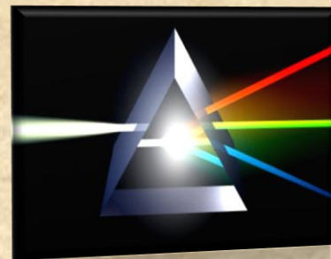
Εικόνα 1 Η διύλιση του φωτός μέσω πρίσματος.

Οπότε, η έτερότητα μέσω αυτής της προσπάθειας νόησης του Ένός που είναι ατελέσφορη, γιατί το ίδιο το Έν δεν μπορεί να νοηθεί αλλά νοεί άλλα πράγματα, είναι σα να το σπάει σε διάφορες εκδοχές -θυμηθείτε την εικόνα με το πρίσμα που το τοποθετώ στο φως και αυτό αναλύεται σε επιμέρους χρώματα τα οποία περιέχονται στο φως.