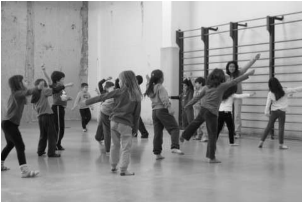
Εικόνα 3: Εκπαίδευση μαθητών