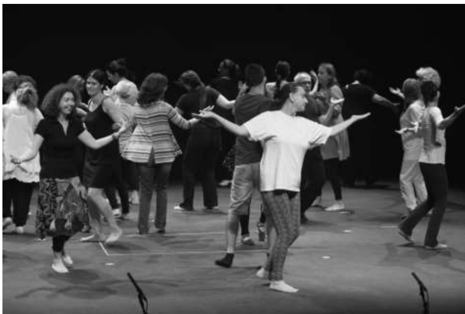
Εικόνα 1: Εκπαίδευση δασκάλων

Το εγχείρημα που ολοκληρώθηκε μέσω της μεθόδου «διευρυμένης» αλληλοδιδασκτικής συμπεριλάμβανε τετράωρα εισαγωγικά εργαστήρια χοροθεάτρου τα οποία παρακολούθησαν 2867 μαθητές και υλοποιήθηκαν από έξι χορευτές της DERIDAnce theatre Ensemble και 52 φοιτητές του Π.Τ.Δ.Ε. Πανεπιστημίου Πατρών. Έλαβαν δε, χώρα μετά από χοροθεατρική παράσταση που αυτοί (φοιτητές και χορευτές) έδωσαν στις αυλές των επιλεγμένων σχολείων. Στόχευαν στην ευαισθητοποίηση των μαθητών για την τέχνη του χοροθεάτρου και αποτελούσαν ξάφνιασμα για αυτούς (τους μαθητές) καθώς δεν γνώριζαν τίποτα από πριν για το καλλιτεχνικό συμβάν.