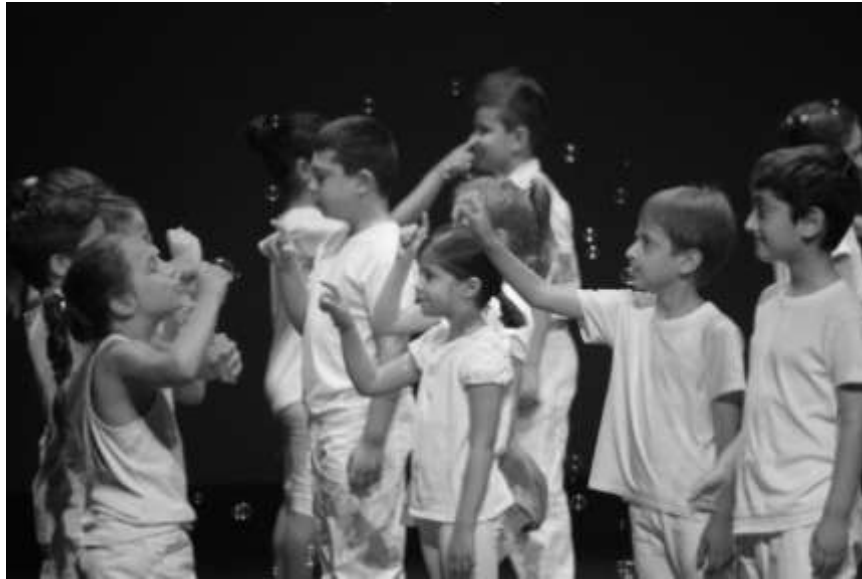
Εικόνα 6: από παραστάσεις μαθητών στο Δημοτικό θέατρο Απόλλων Πάτρα