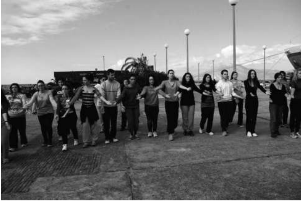
Εικόνα 2: Εκπαίδευση φοιτητών