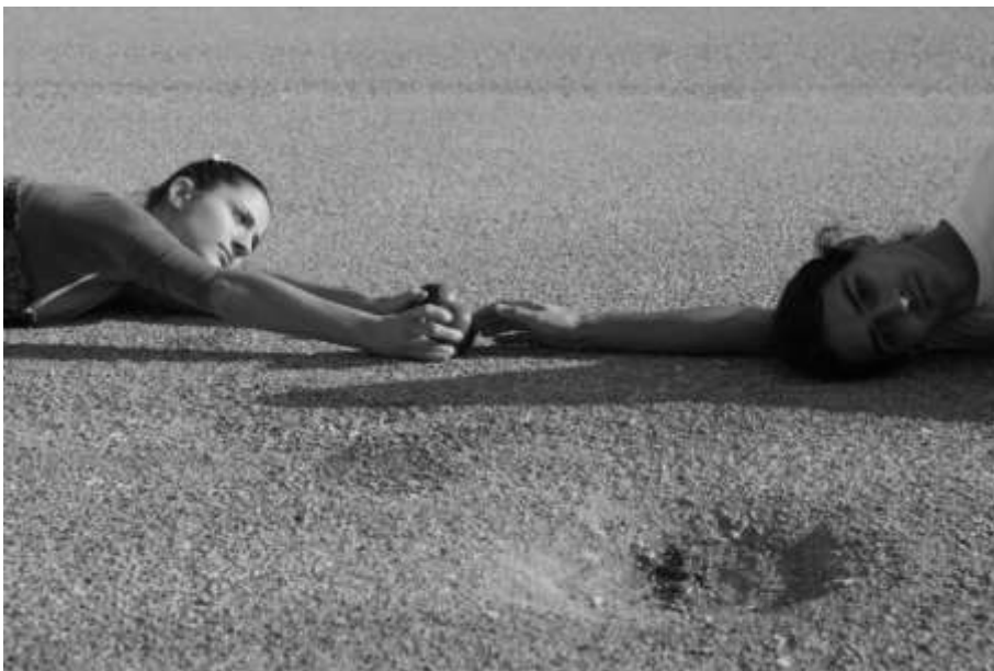
Εικόνα 5: από τις παραστάσεις που έδωσαν φοιτητές και χορευτές στις αυλές σχολείων