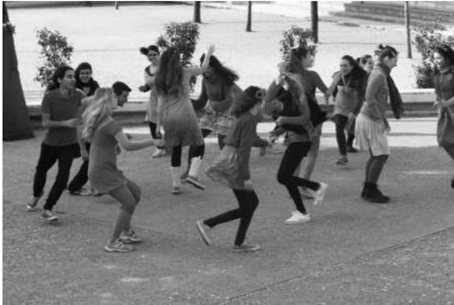
Εικόνα 4: από τις παραστάσεις που έδωσαν φοιτητές και χορευτές στις αυλές σχολείων