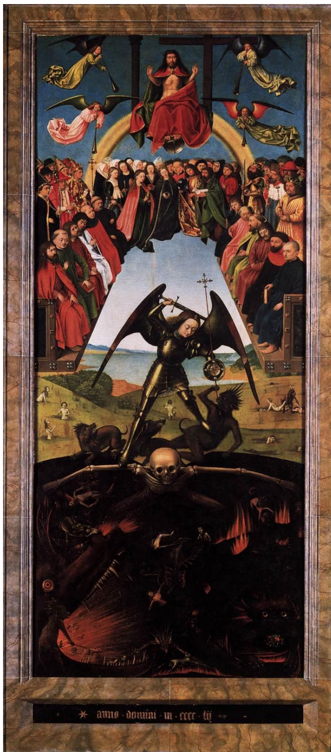
Εικόνα 1. Petrus Christus, Δευτέρα Παρουσία, 1452.