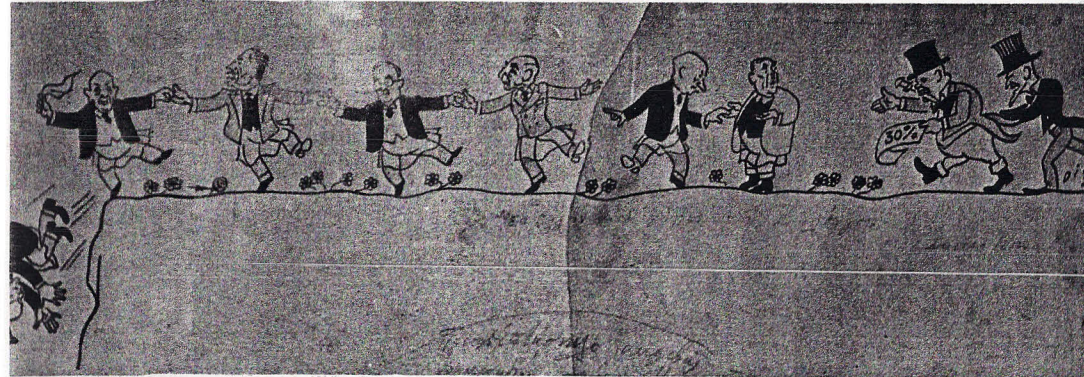
Πολιτικὴ γελοιογραφία τοῦ 1932.

Ὅταν ἀρχίζει ἡ περίοδος τῆς Κατοχῆς, τὸ πνεῦμα τῆς ἀντίστασης ποὺ ἀναπτύσσεται δὲν εἶναι ὀργανωτικὰ εἶναι ὅμως ψυχολογικὰ προετοιμασμένο. Τὸ ἔθνικὸ καὶ τὸ πολιτικὸ πρόβλημα (γιὰ τοὺς ἀνθρώπους ποὺ, νεώτατοι, δὲν ἔχουν περάσει στὸ στάδιο τῆς ἐπαγγελματικῆς σκοπιμότητος καὶ φθορᾶς) ταυτίζονται μὲ τὸ ἠθικὸ πρόβλημα. Ἀπὸ τὰ στοιχεῖα ποὺ μοῦ παραχώρησαν οἱ ἴδιοι οἱ ποιητὲς τῆς γενιᾶς βλέπω ὅτι κανεὶς δὲν ἔμεινε ἀδιάφορος καὶ σχεδὸν ὅλοι πῆραν μέρος σὲ κάποια μορφή ἀγώνα κατὰ τῶν ἀρχῶν Κατοχῆς. Μερικοὶ μάλιστα χώθηκαν στὴν ὑπόθεση ὡς τὸ λαιμὸ, διακινδυνεύοντας τὴ ζωὴ τους «σὲ κάθε γωνιά καὶ σοκάκι» ὅπως ἔγραψε ἕνας ποιητῆς. Τὸ συλλογικὸ πνεῦμα καὶ ἡ ὁμοψυχία ποὺ χαρακτήριζαν τὰ πρώτα χρόνια τῆς Κατοχῆς συντελοῦσαν, ὥστε ὅλες οἱ παράνομες καὶ ποικίλων τάσεων ὀργανώσεις, μικρὲς, μεσαῖες, μεγάλες, νὰ δουλεύουν χωρὶς νὰ ἀναπτύσσουν ἕνα πνεῦμα ἀντιδικίας ἀνάμεσά τους, μὲ συνέπεια οἱ μαζικὲς ἐκδηλώσεις νὰ στελεχώνονται ἀπὸ ὅλες τὶς τάσεις, ἀνεξάρτητα ἀπὸ τὸν βασικὸ φορέα ὁ ὁποῖος τὶς καθοδη-