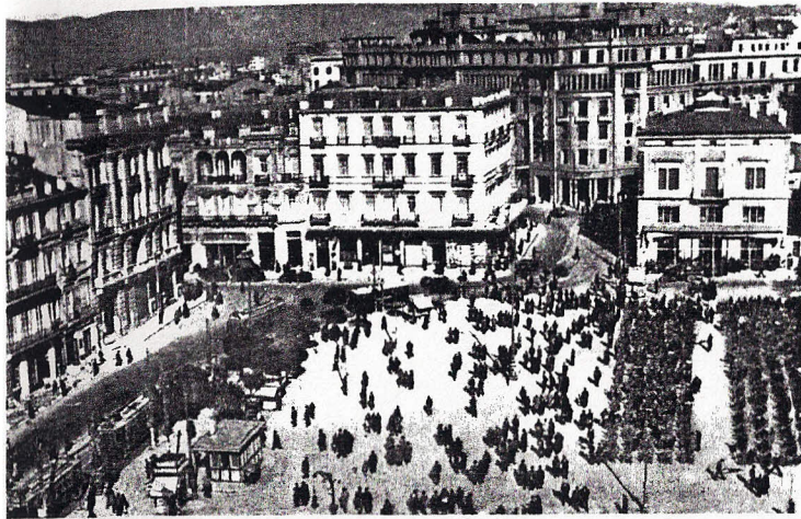
Ἡ πλατεία Συντάγματος τῆ δεκαετία τοῦ 1940.