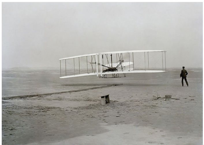
Η πρώτη πτήση του Wright Flyer I, 17 Δεκεμβρίου 1903.