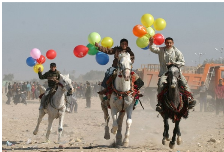
Νεαροί Ιρακινοί με μπαλόνια.

Οι επιστήμονες ομολογούν ότι από το 2009, όταν δημοσιεύθηκαν τα πρώτα ευρήματα του μοντέλου, οι συγκρούσεις στη Μέση Ανατολή αποδυνάμωσαν την σαφή συσχέτιση ανάμεσα στην κοινωνικο-οικονομική ανάπτυξη και στην απουσία εμφυλίου πολέμου, ενώ οι πόλεμοι στη Συρία και στον Λίβανο έδειξαν ότι πρέπει να συμπεριλάβουμε στο μοντέλο και τις διαδικασίες εκδημοκρατισμού.