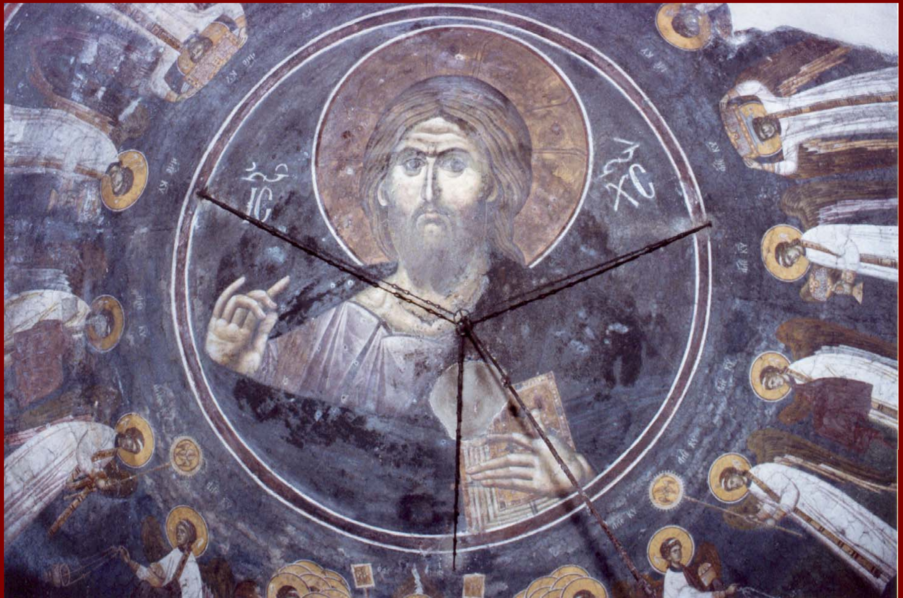
Σερβία, Gracanica. Παντοκράτορας τρούλου και Ουράνια Λειτουργία