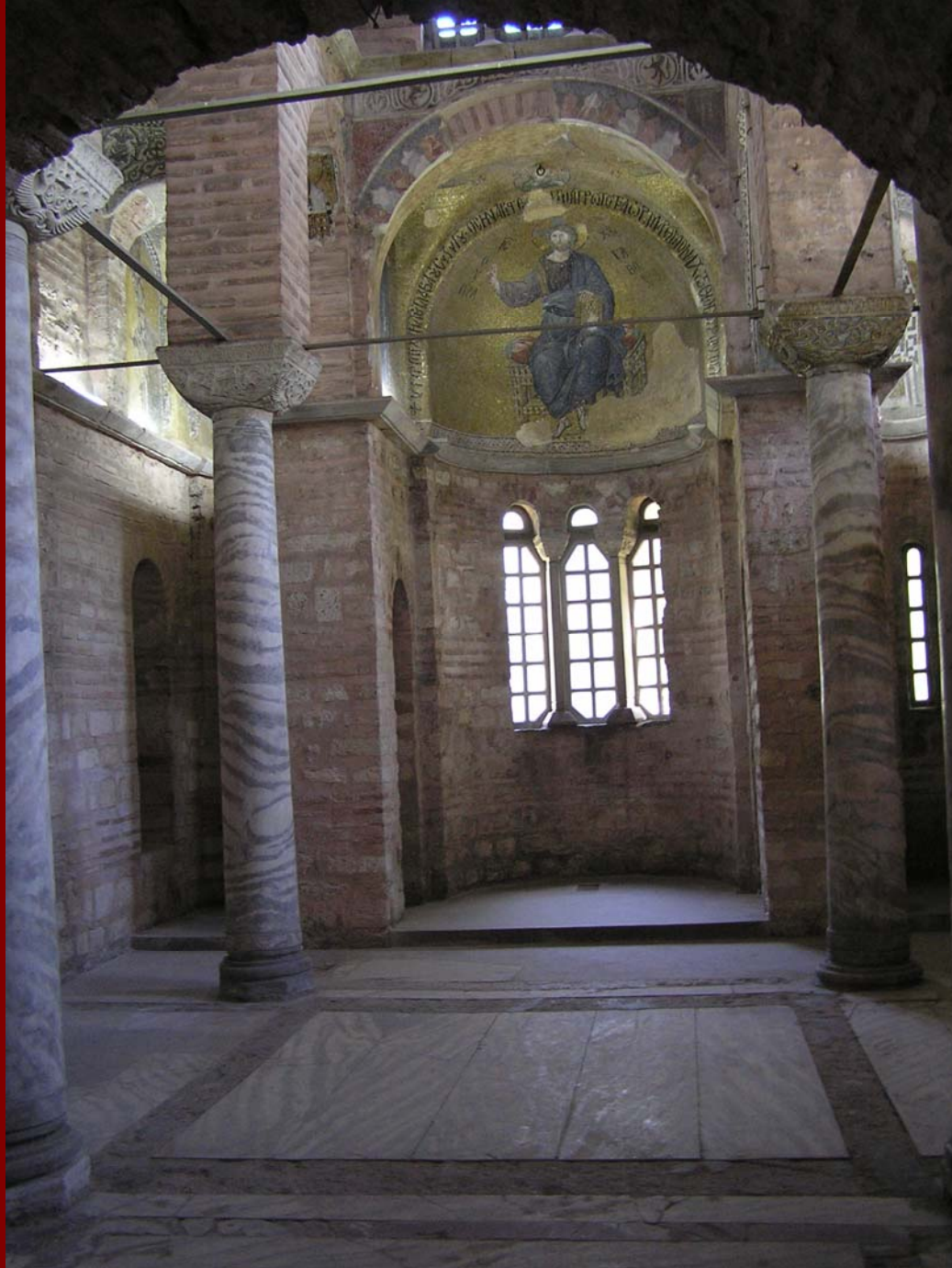
Κωνσταντινούπολη, Μ. Παμμακαρίστου. Παρεκκλήσιο, προς Ανατολικά, 1304-1308