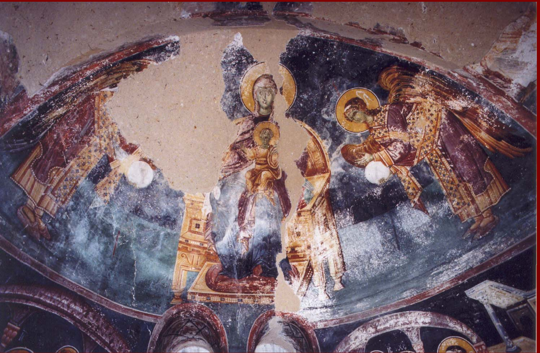
Σερβία, Studenica, Εκκλησία του Milutin. Παναγία αψίδας, περί το 1315