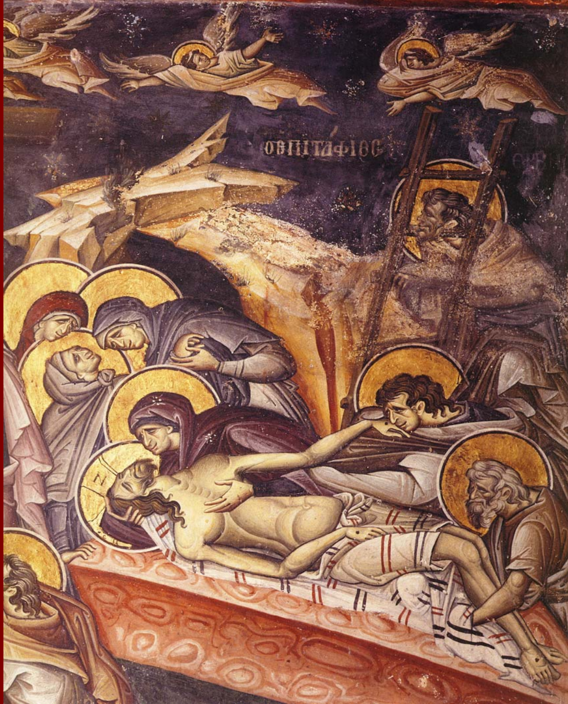
Άγ. Όρος. Μονή Βατοπαιδίου. Επιτάφιος Θρήνος, 1315 περ.