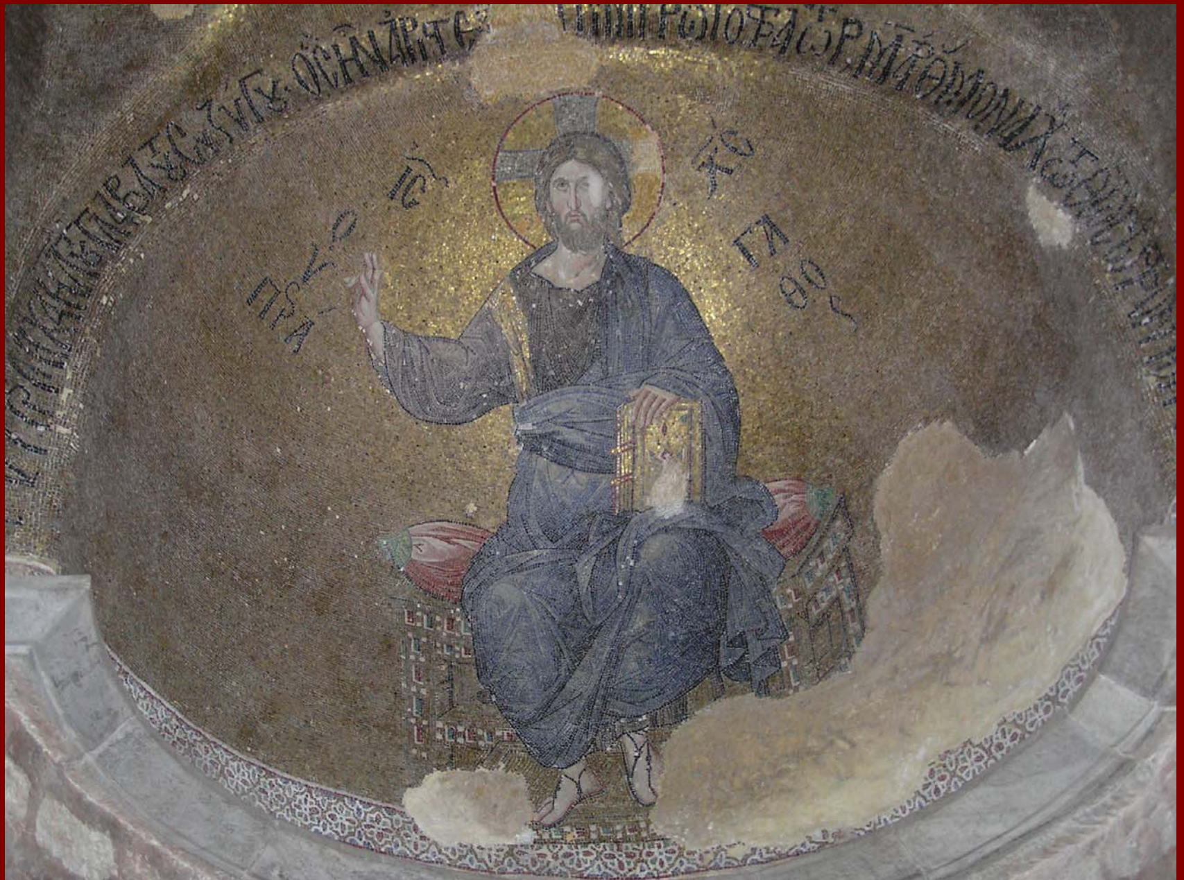
Κωνσταντινούπολη, Μ. Παμμακαρίστου. Χριστός αψίδας, 1304-1308