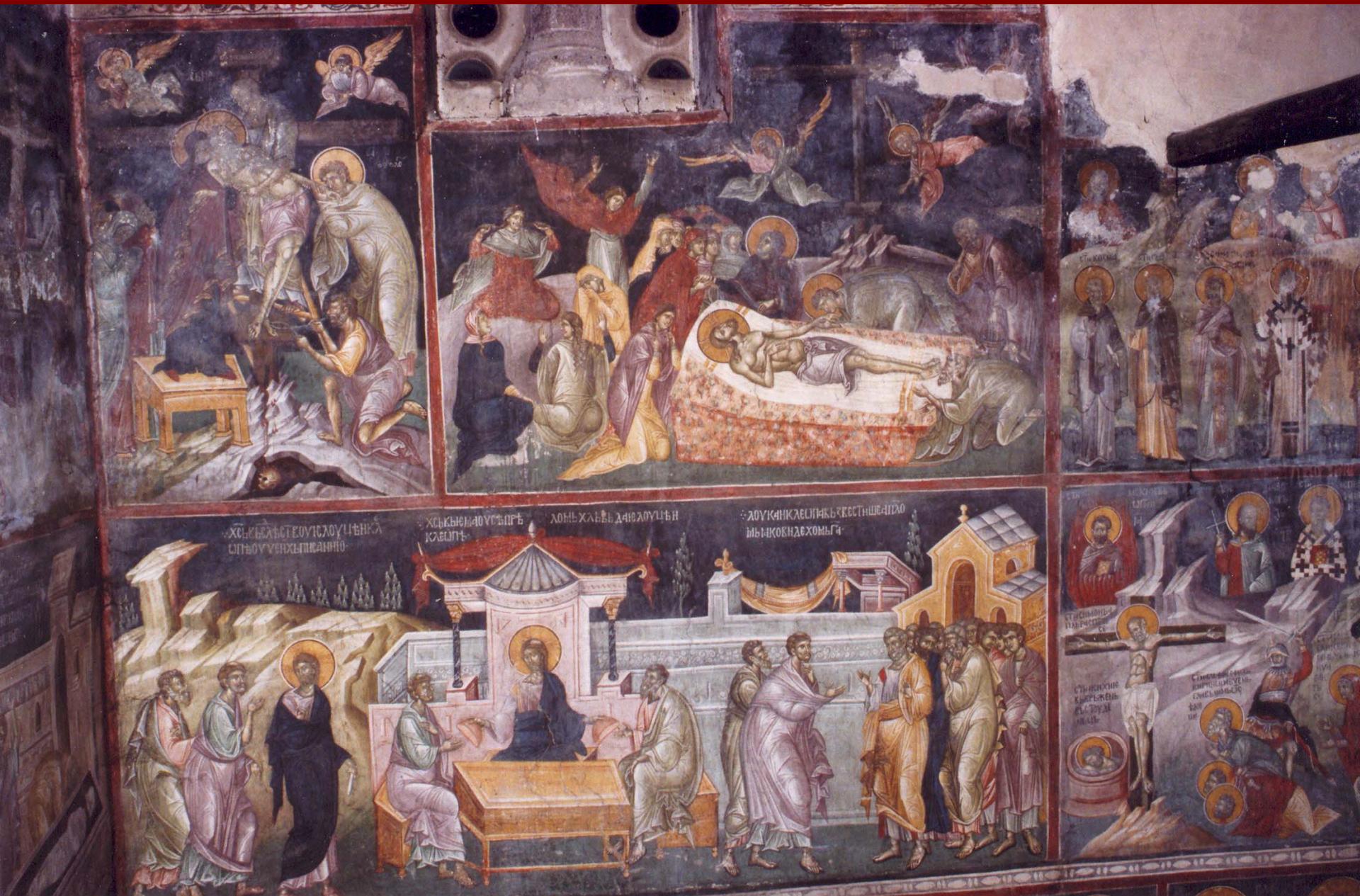
Σερβία, Gracanica, 1320, περ.