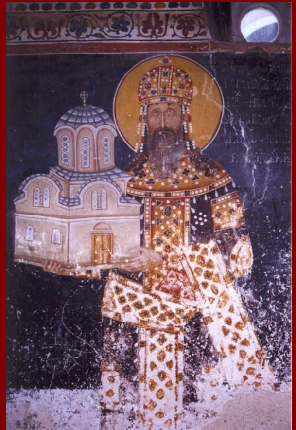
Σερβία, Studenica, Εκκλησία του Milutin, 1315