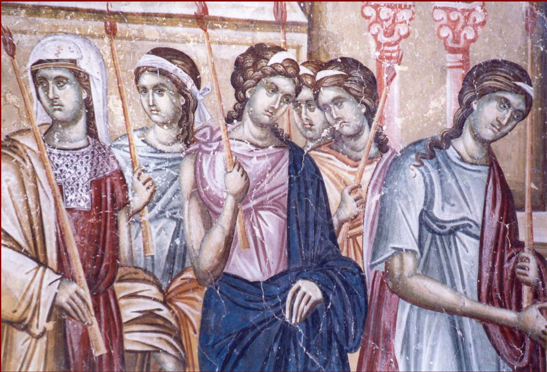
Σερβία, Studenica, Εκκλησία του Milutin. Εισόδια Θεοτόκου (λεπτ.) 1315