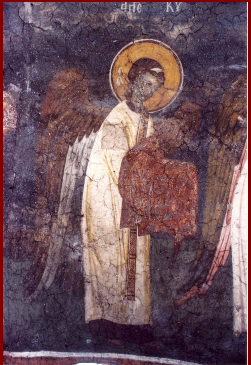
Σερβία, Gracanica. Ουράνια Λειτουργία (λεπ.), 1320