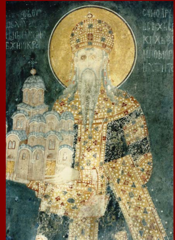
Σερβία, Gracanica. Άποψη από Δυτ., 1320 περ.