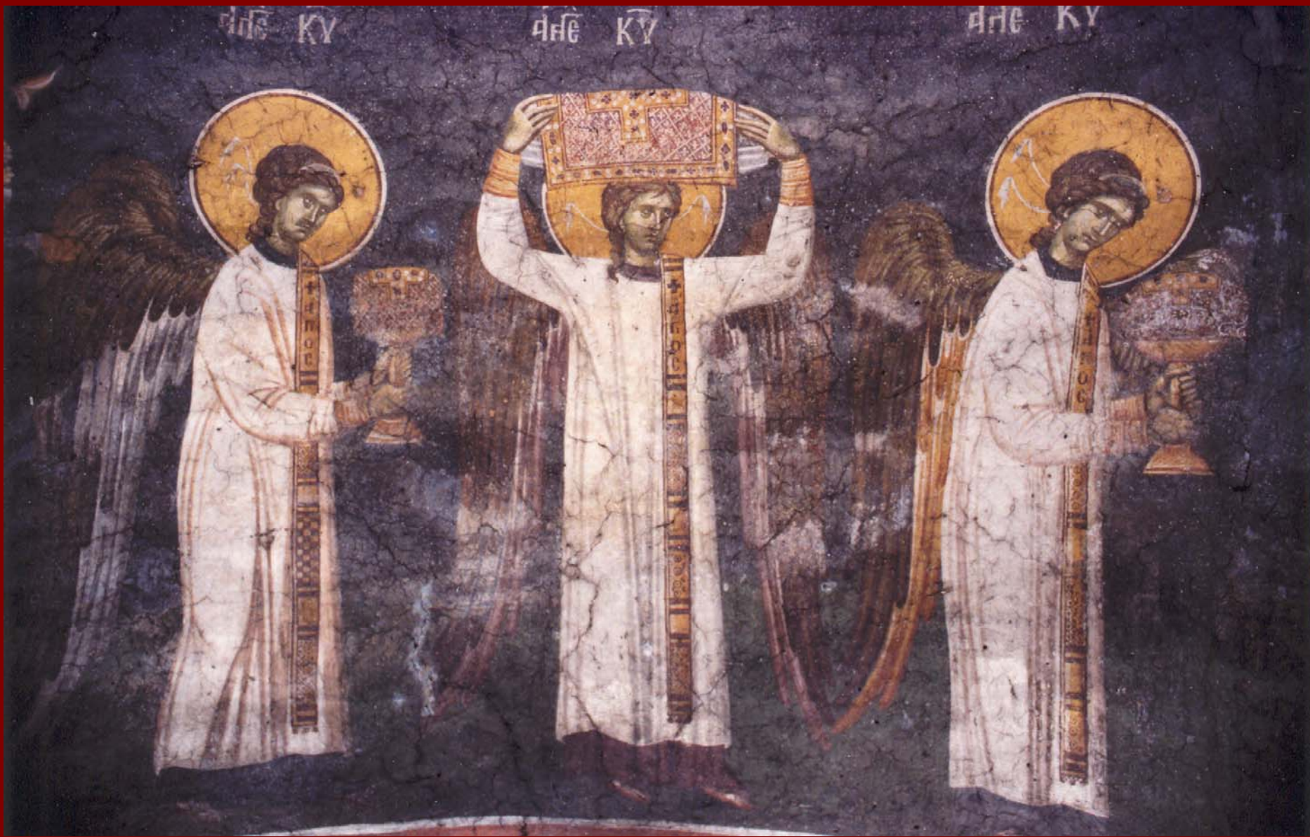
Σερβία, Gracanica. Ουράνια Λειτουργία (λεπτ.), 1320