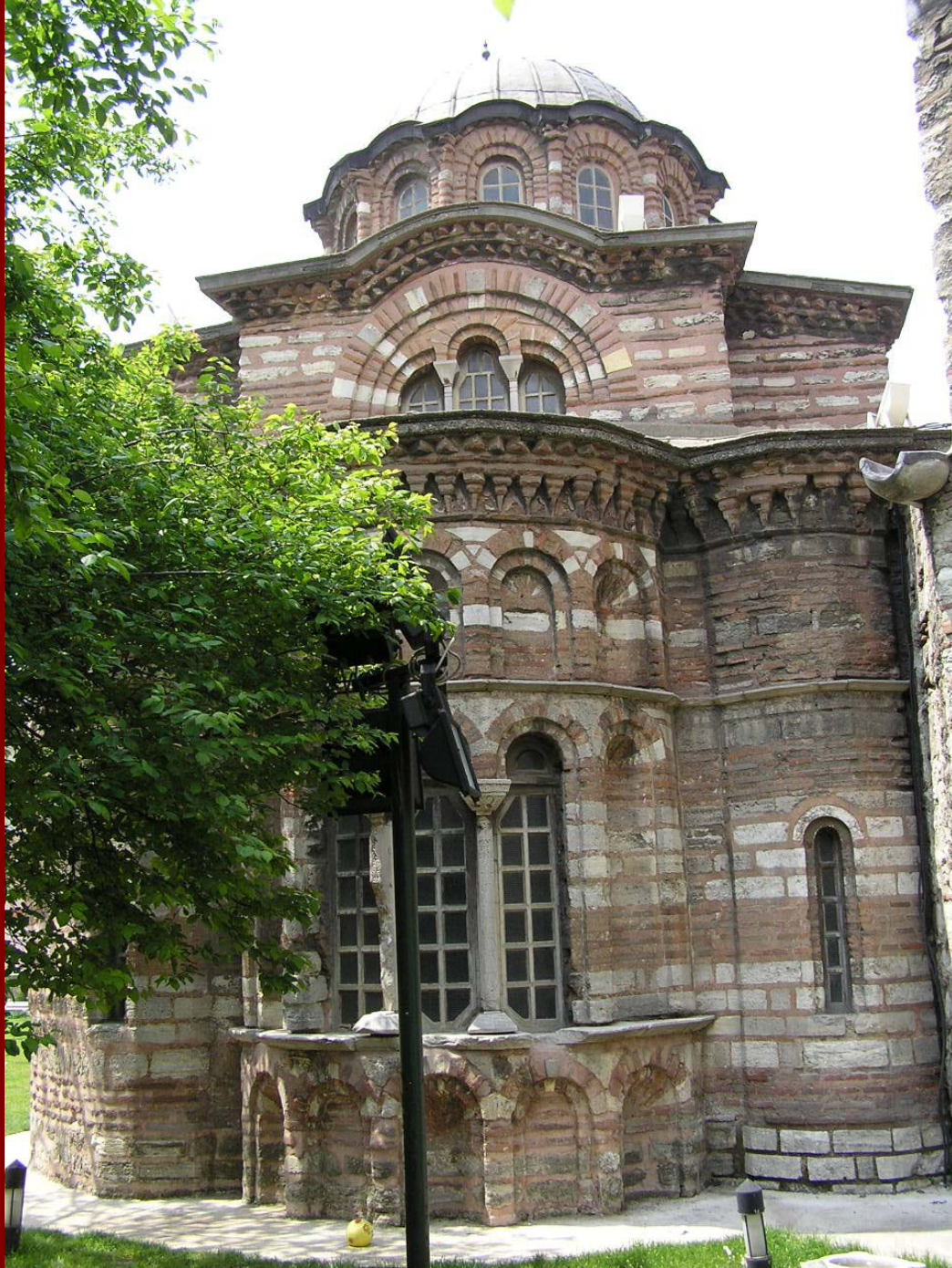
Κωνσταντινούπολη, Μ. Παμμακαρίστου, άποψη από Ανατολικά