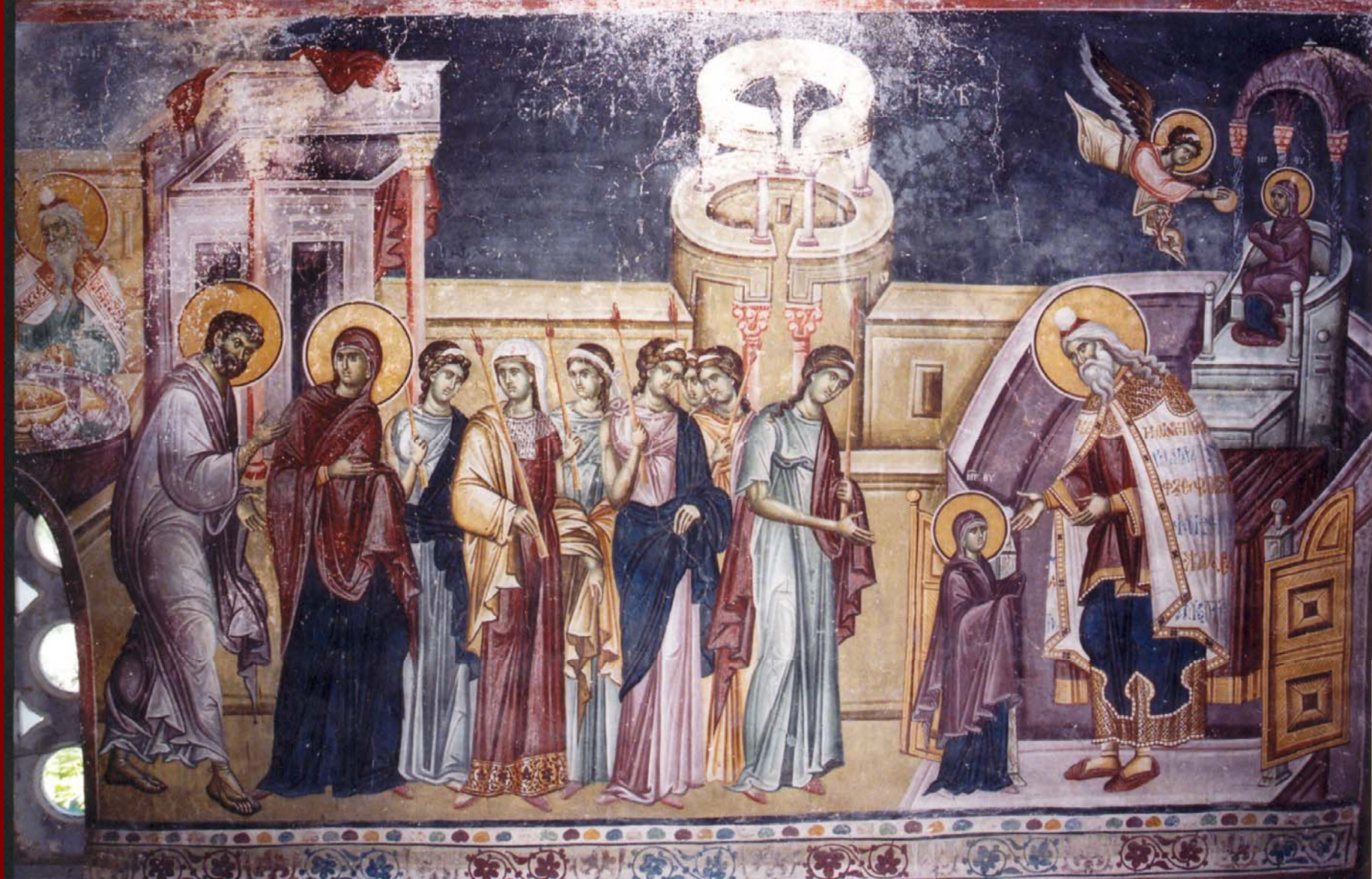
Studenica, Εκκλησία του Milutin. Εισόδια της Θεοτόκου, 1315