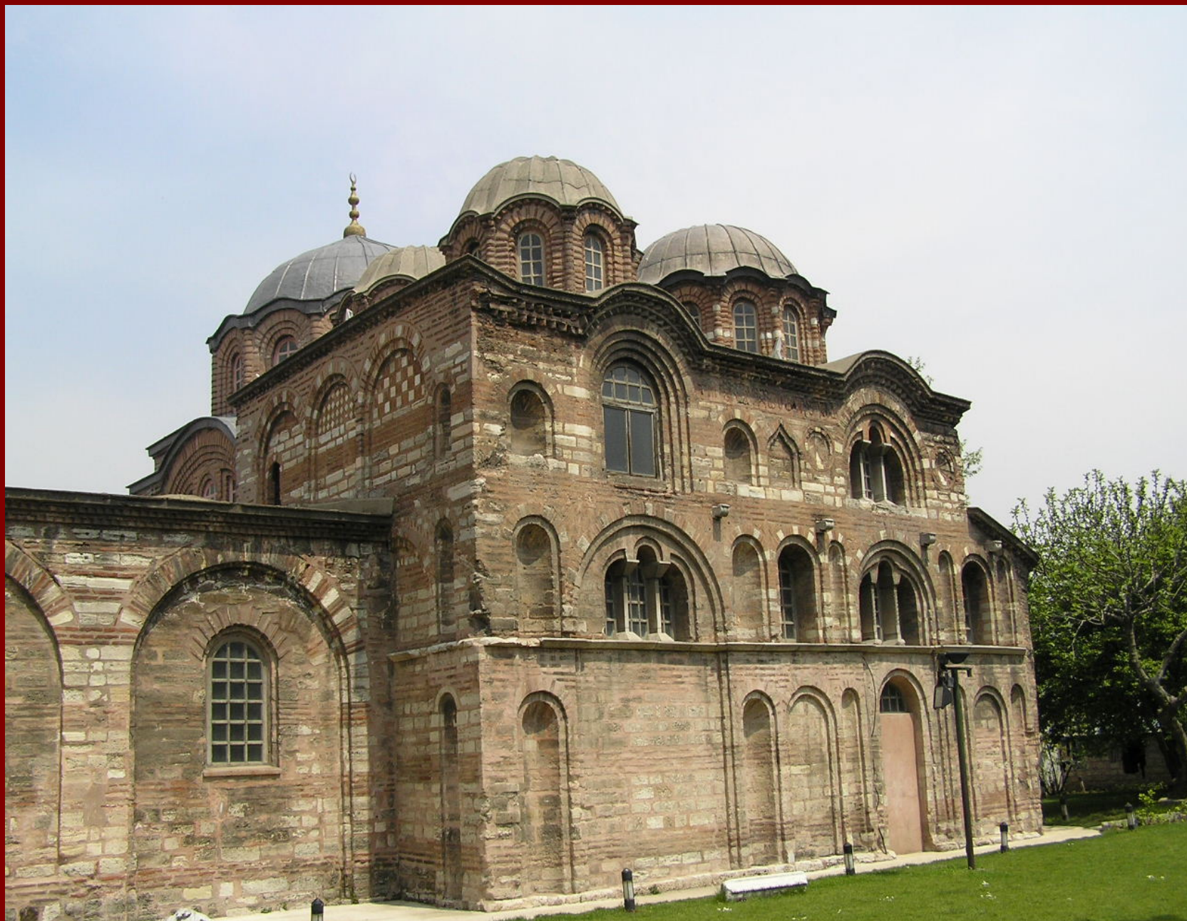
Κωνσταντινούπολη, Μ. Παμμακαρίστου. Άποψη από Δυτικά, 1290 και 1304-1308