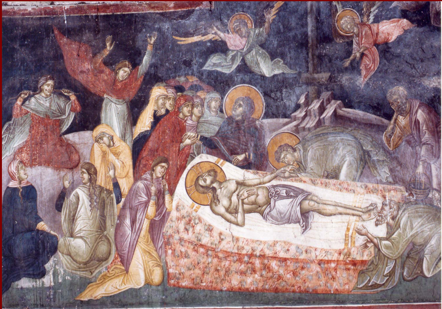
Σερβία, Gracanica. Επιτάφιος Θρήνος, 1320 περ.