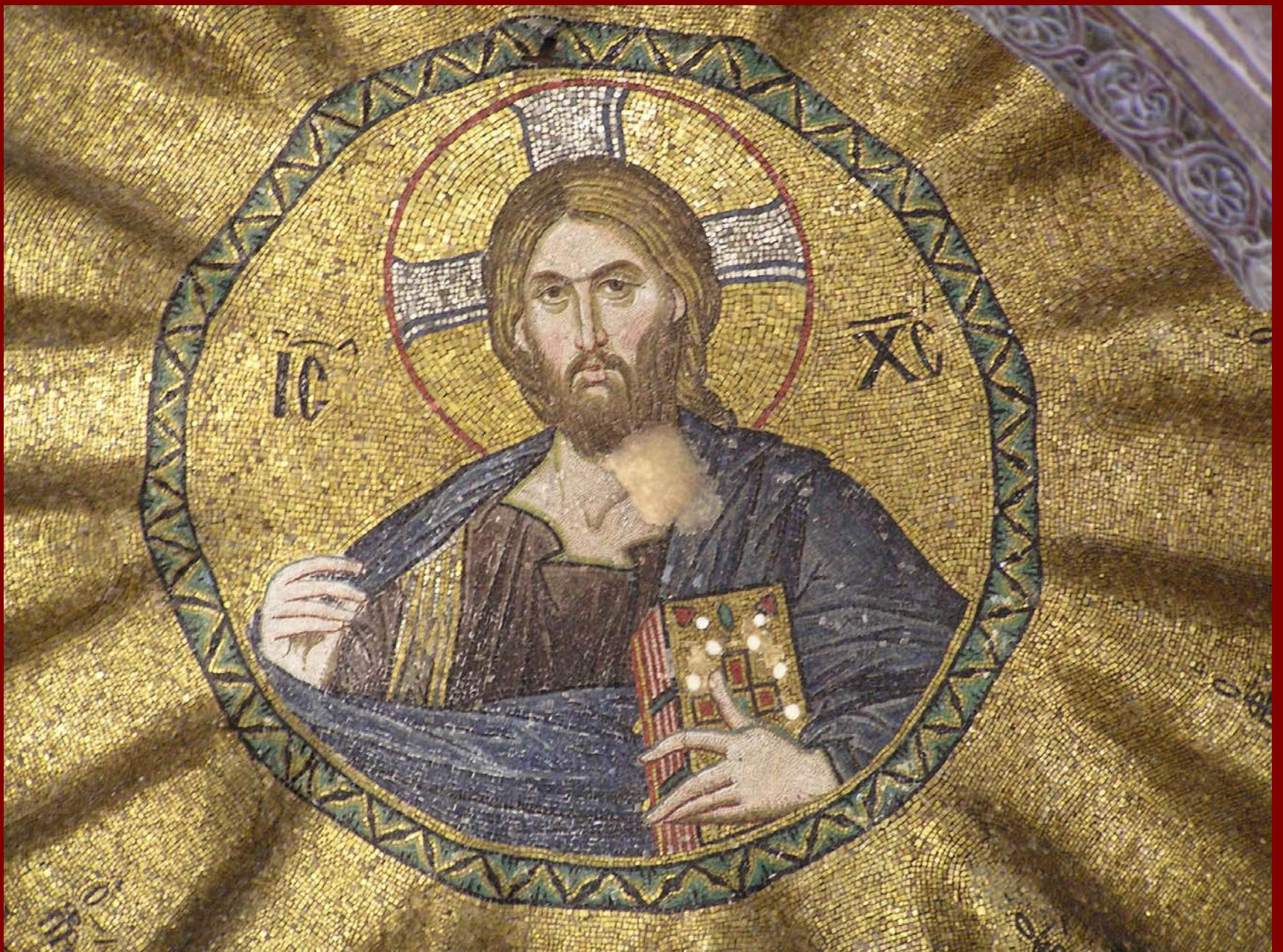
Κωνσταντινούπολη, Μ. Παμμακαρίστου. Παντοκράτορας τρούλου, 1304-1308