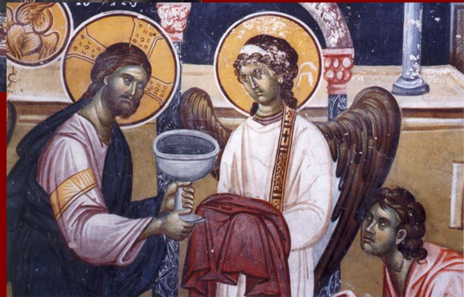
Studenica, Εκκλησία του Milutin. Κοινωνία των Αποστόλων, 1315