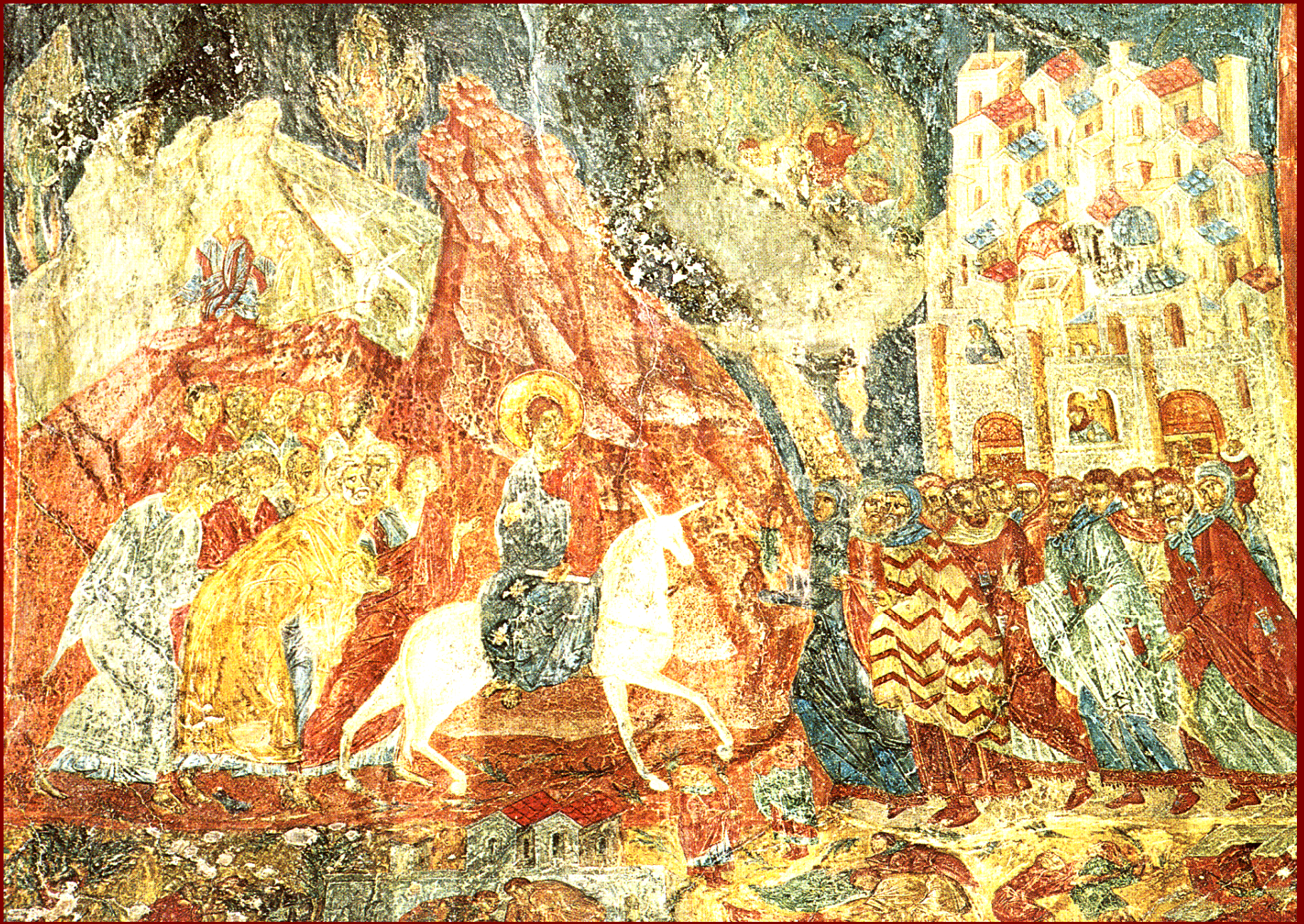
Μυστράς, Περίβλεπτος. Είσοδος στα Ιεροσόλυμα, 1360 περ.