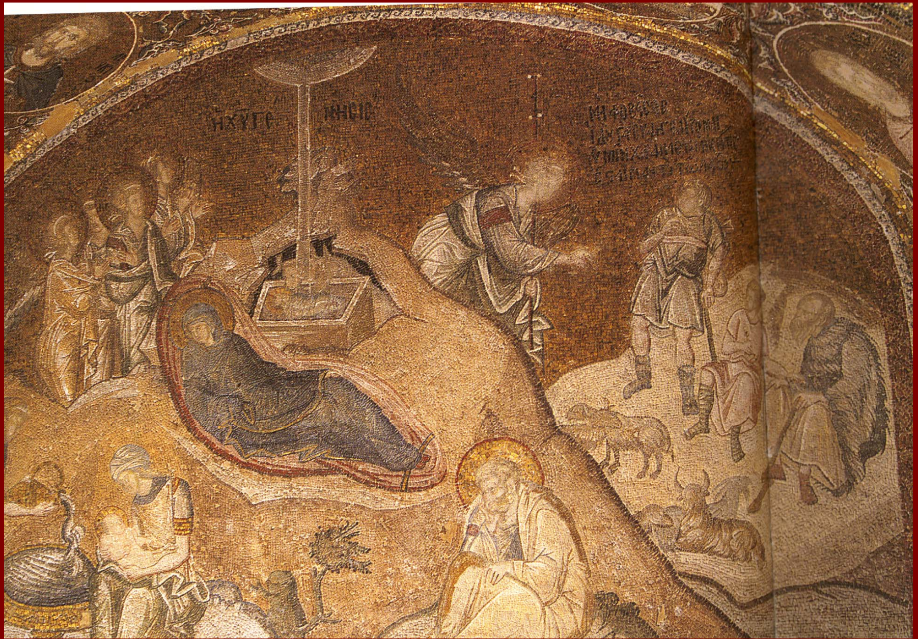
Κωνσταντινούπολη, Μονή της Χώρας, Εξωνάρθηκας. Γέννηση του Χριστού 1315-1320