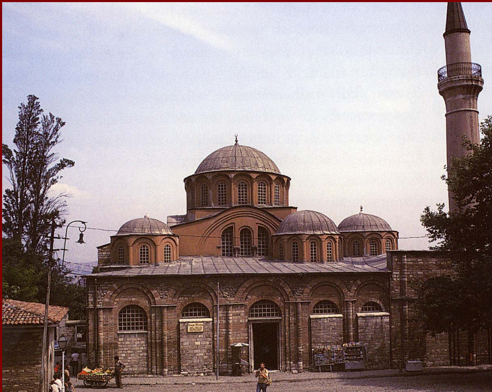
Κωνσταντινούπολη, Μονή της Χώρας, άποψη από δυτικά, 1315