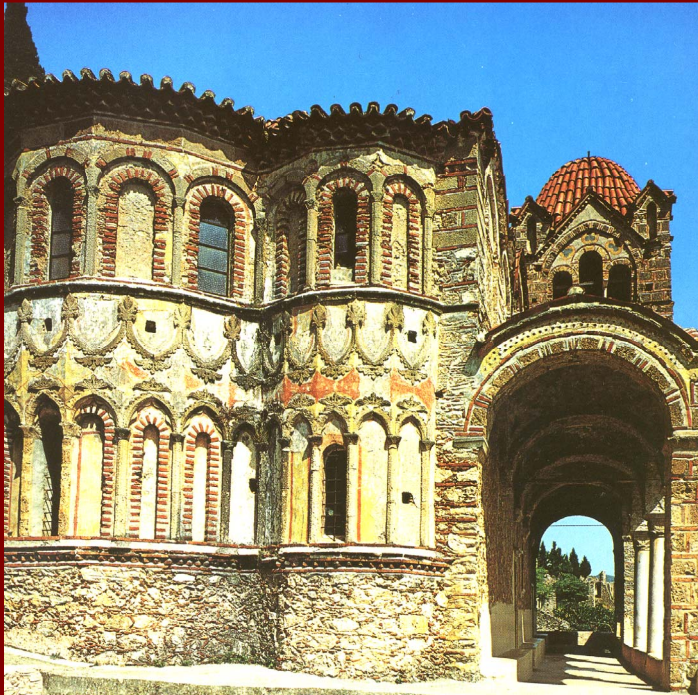
Μυστράς, Μ. Παντάνασσας. Η εξωτερική διακόσμηση των αψίδων και η Βόρεια στοά.