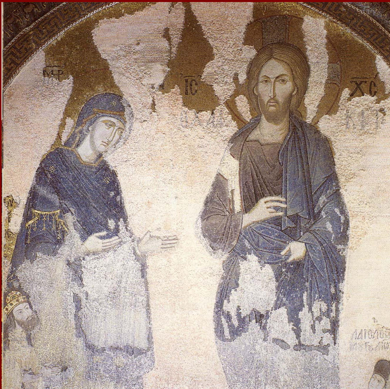
Μονή της Χώρας. Ο Χριστός με τη Θεοτόκο και δωρητές της Μονής, 1315-1320