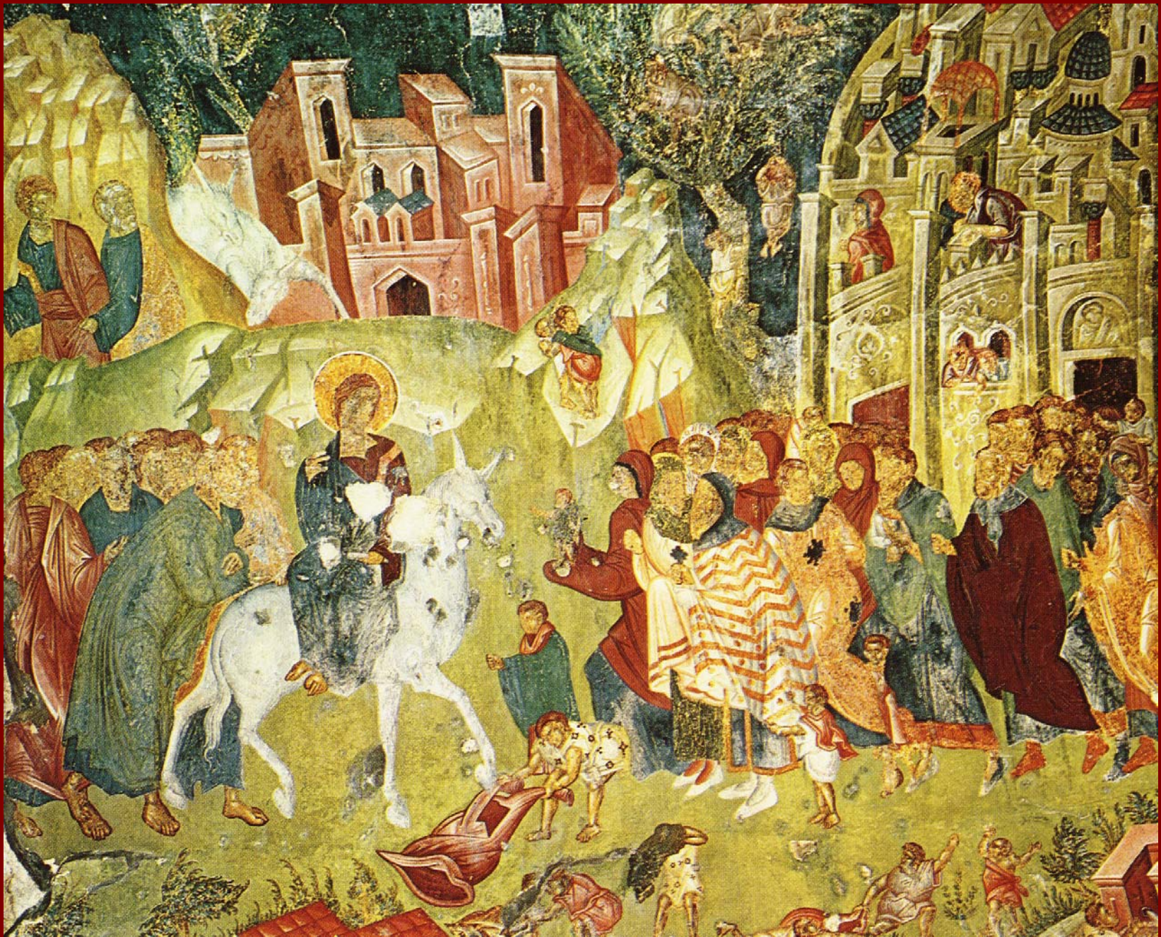
Μυστράς, Παντάνασσα. Είσοδος στα Ιεροσόλυμα, 1428