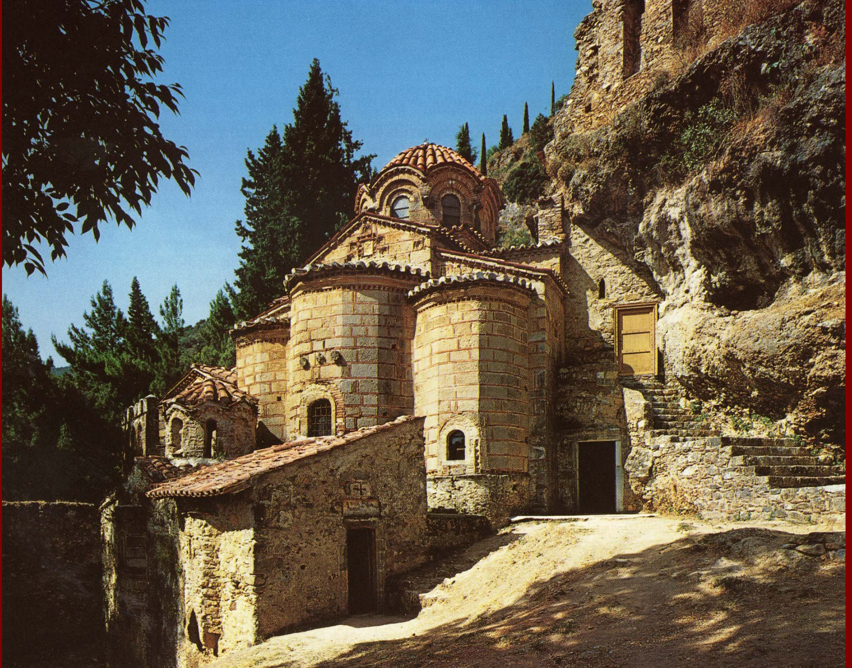
Μυστράς, Περίβλεπτος, 1360 περ.