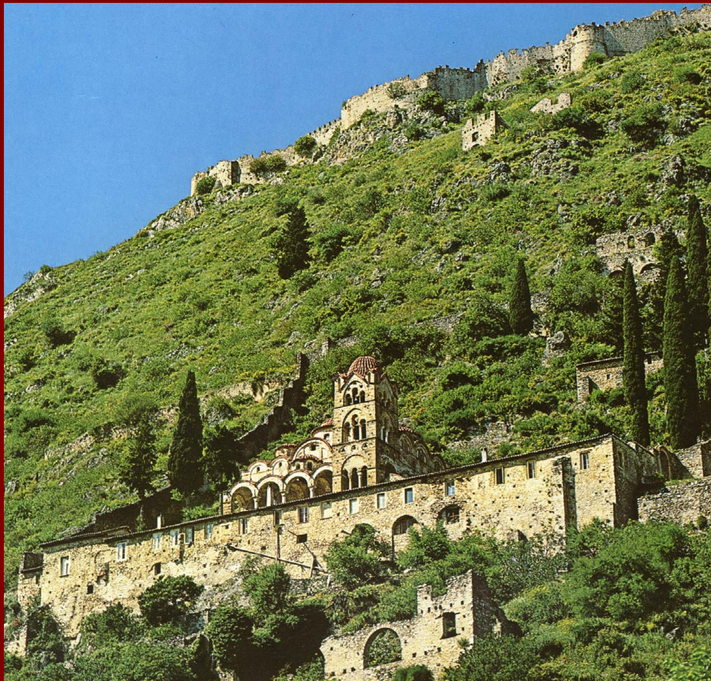
Μυστράς, Μονή Παντάνασσας και ψηλά το κάστρο, 1428.