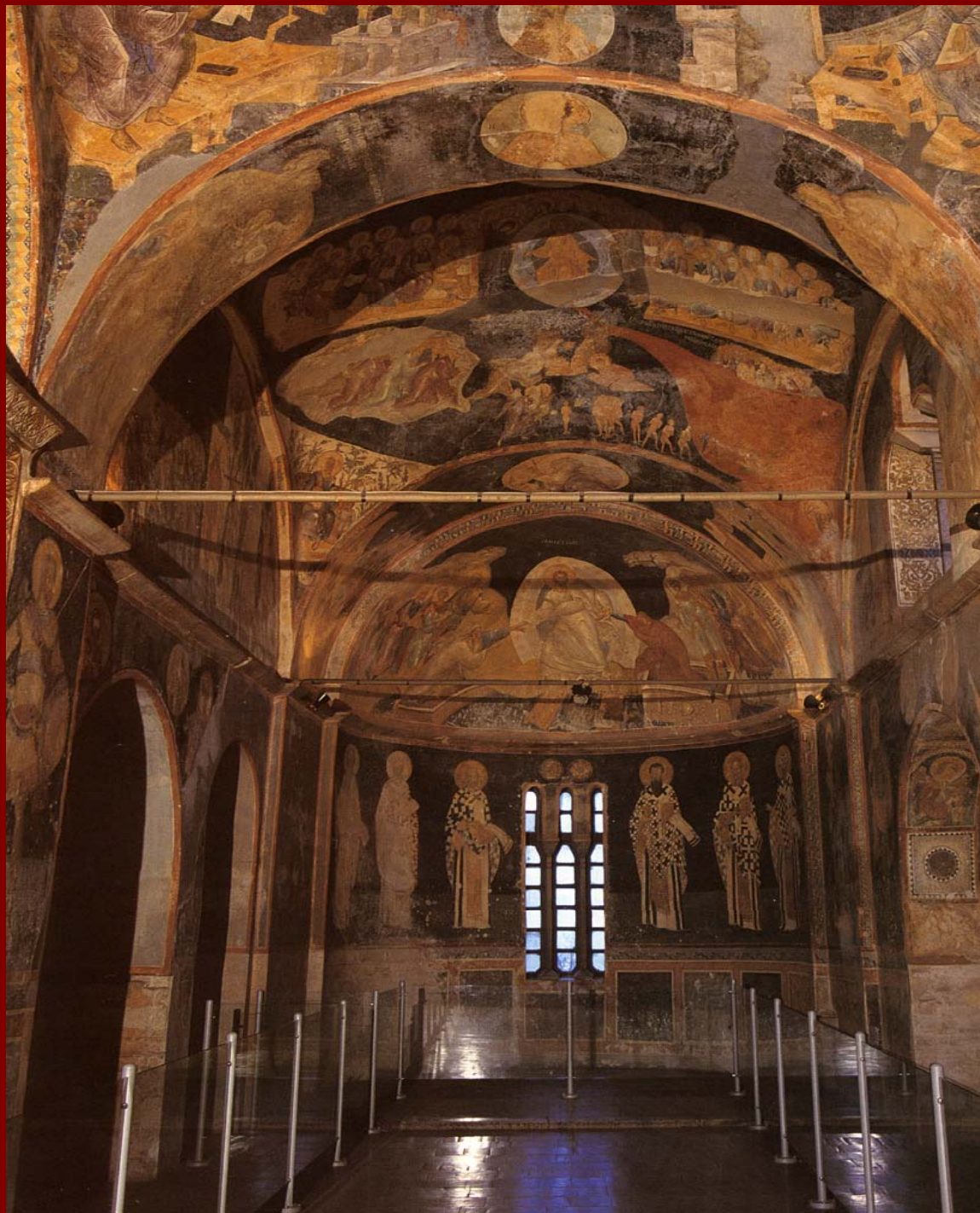
Κων/πολη, Μονή της Χώρας, Παρεκκλήσιον, 1315-1320