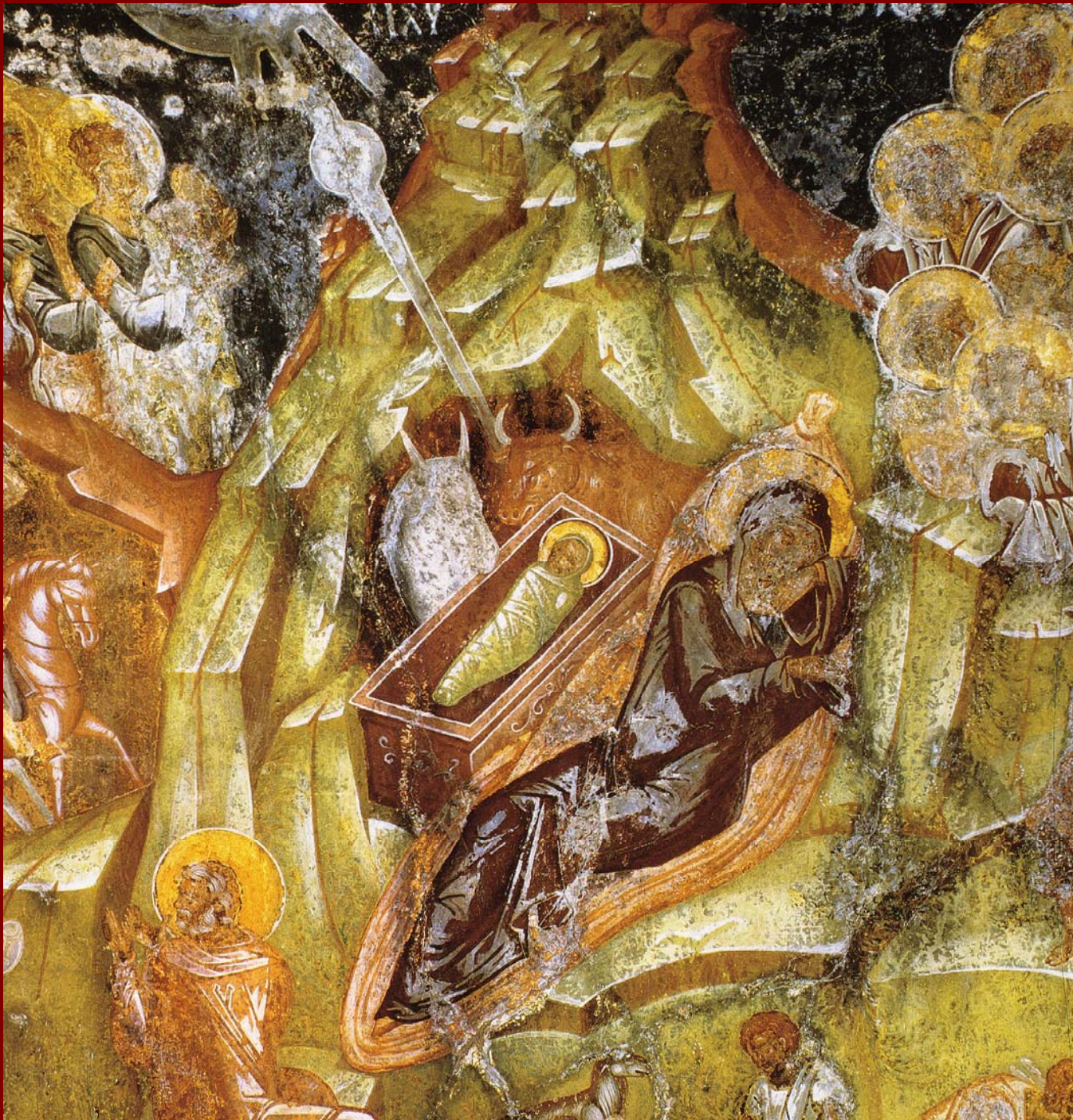
Μυστράς, Παντάνασσα. Γέννηση, 1428