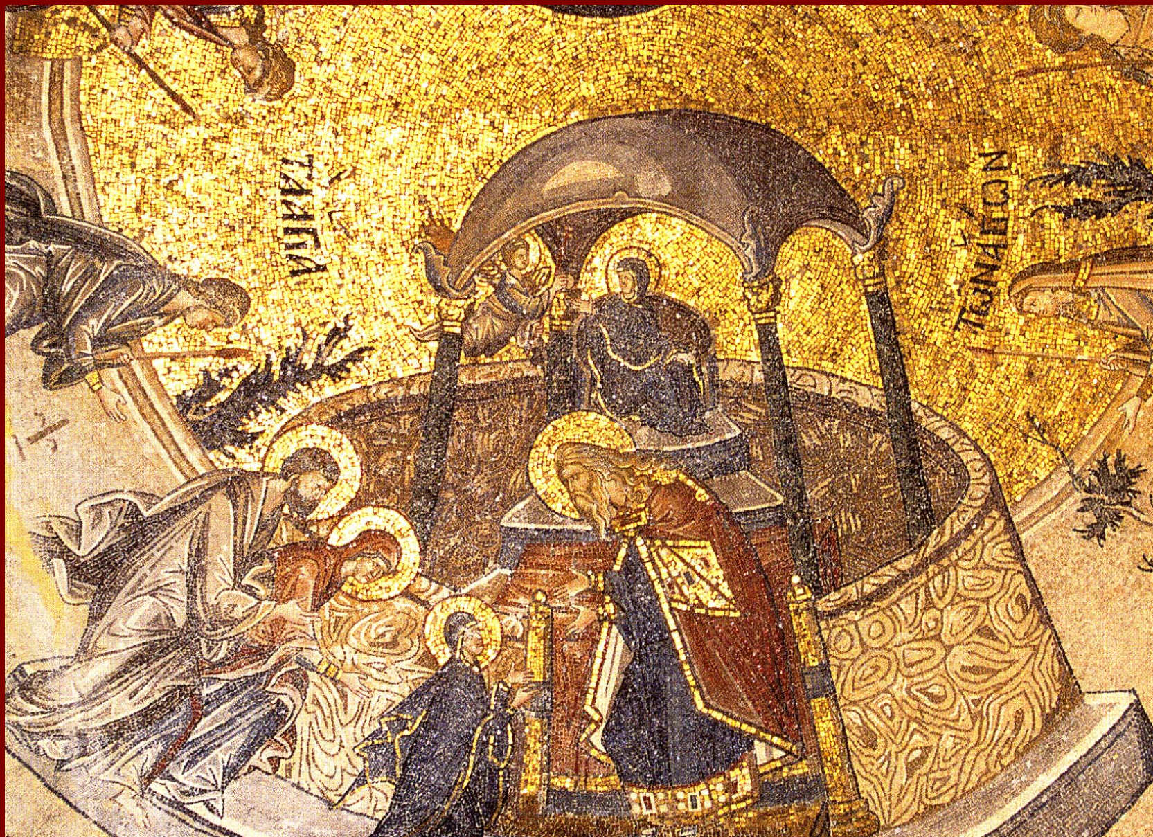
Κωνσταντινούπολη, Μονή της Χώρας, εσωνάρθηκας. Τα Εισόδια της Θεοτόκου, 1315-1320