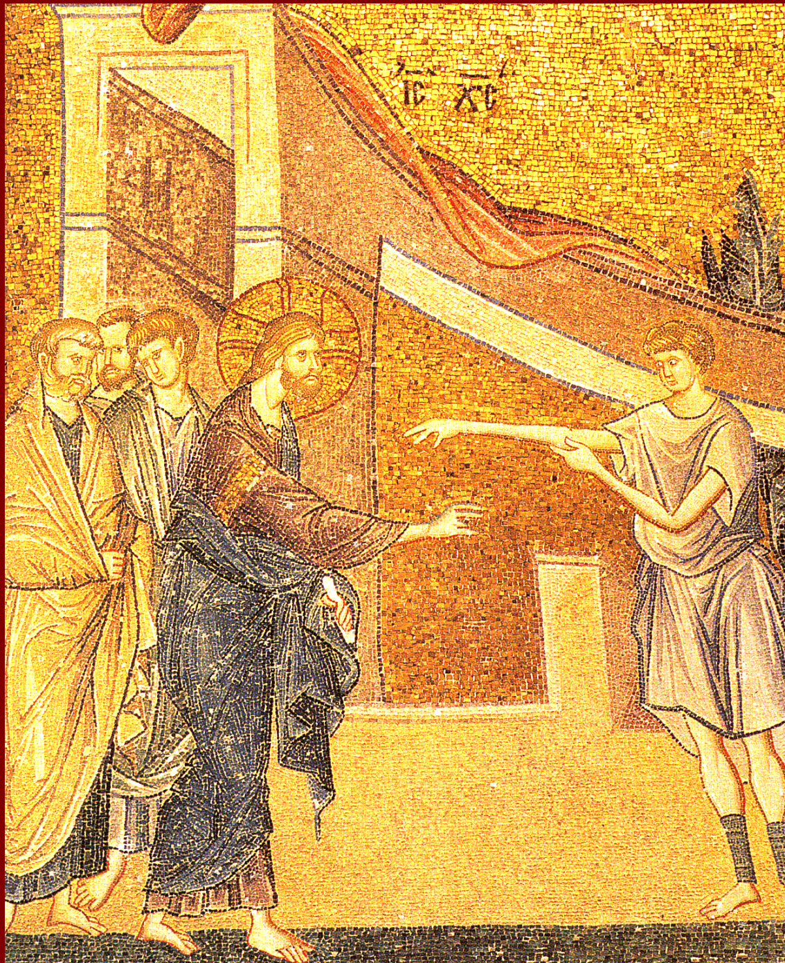
Μονή της Χώρας. Η θεραπεία του χωλού, 1315-1320