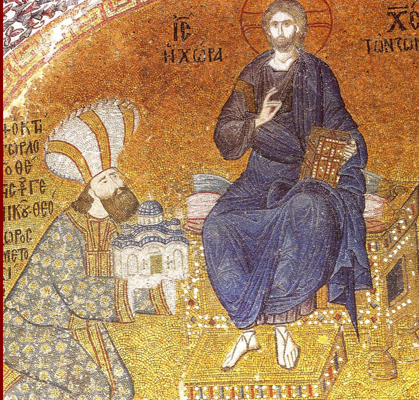
Κωνσταντινούπολη, Μονή της Χώρας. Ο Μετοχίτης προσφέρει το ομοίωμα της Εκκλησίας στο Χριστό, 1315-1320.