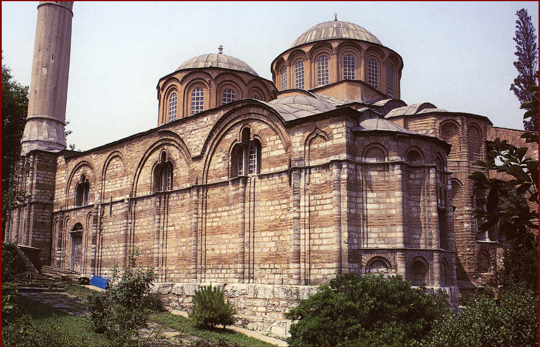
Κωνσταντινούπολη, Μονή της Χώρας, άποψη από ΝΑ, 1315 περ.