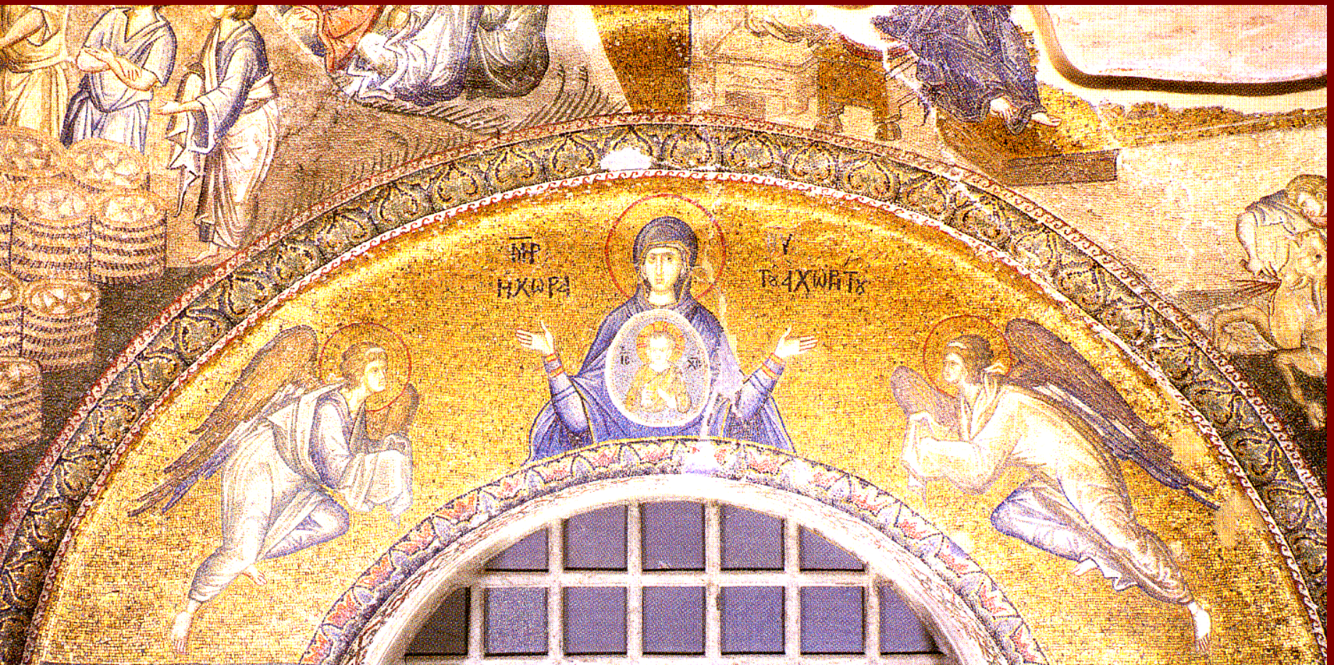
Κωνσταντινούπολη, Μονή της Χώρας. Παναγία Βλαχερνίτισσα, 1315-1320