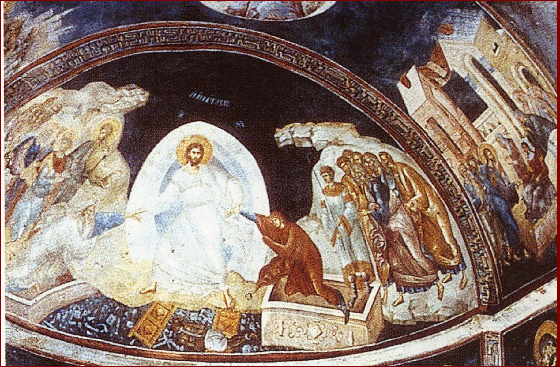
Κωνσταντινούπολη, Μονή της Χώρας, Παρεκκλήσιο. Ανάσταση 1315-1320