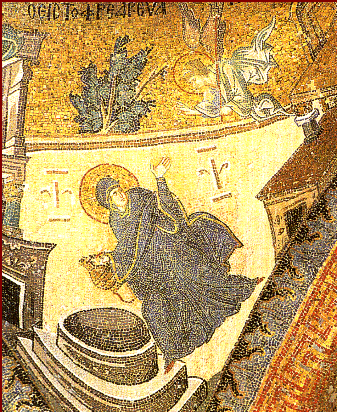
Κωνσταντινούπολη, Μονή της Χώρας. Ο Ευαγγελισμός στο φρέαρ , 1315-1320