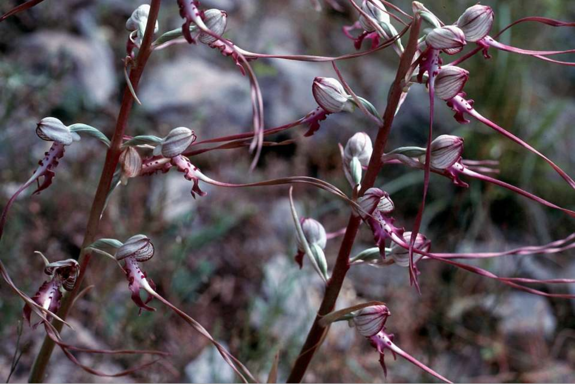
Himantoglossum hircinum ssp. calcaratum