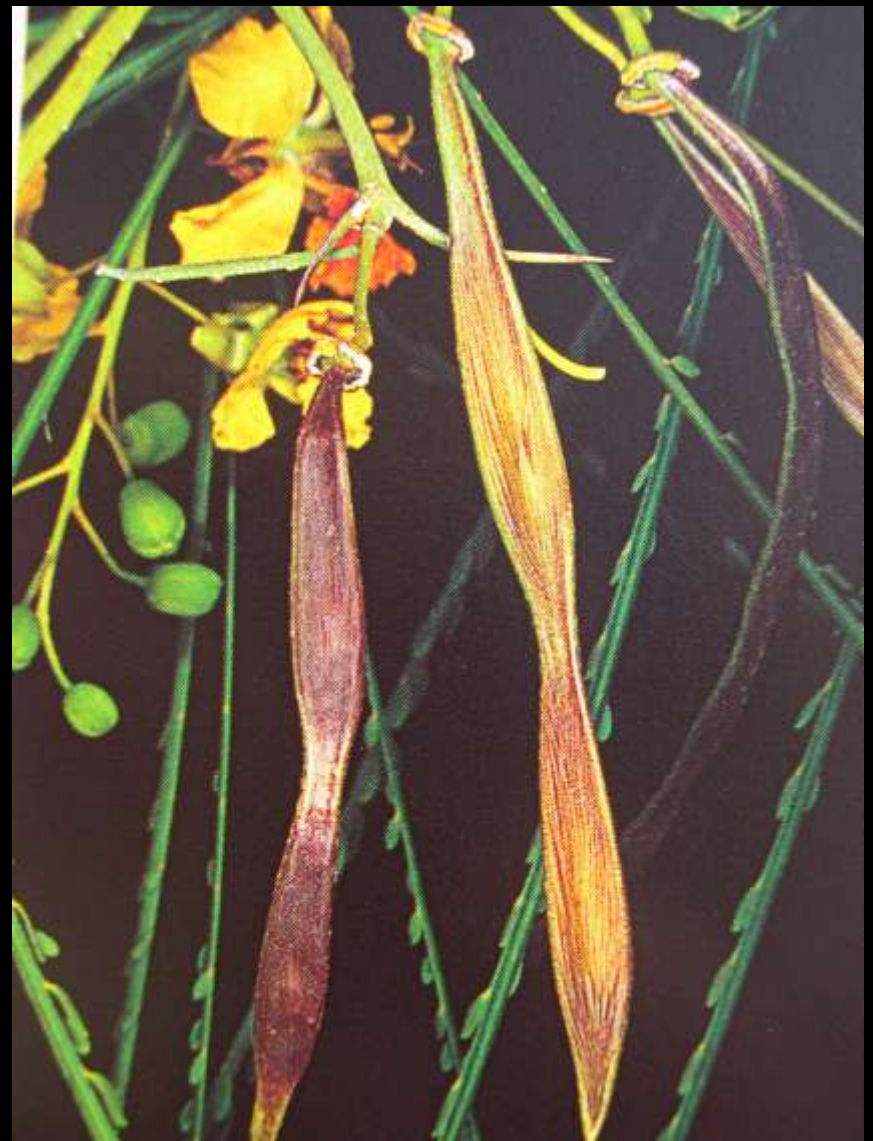
Parkinsonia aculeata L. Παρκινσόνια η αγκαθωτή