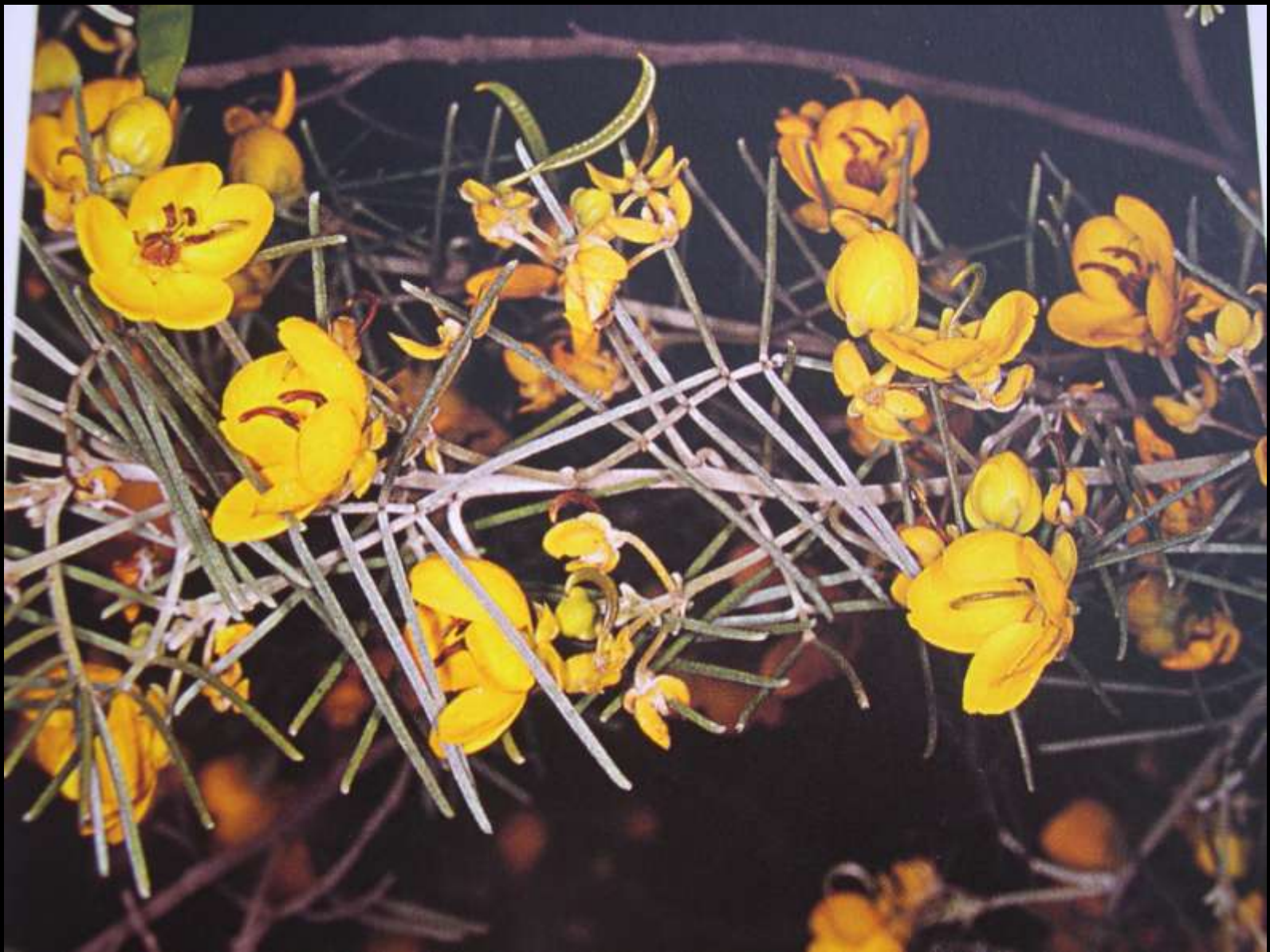
Cassia corymbosa Lam. Κάσσια η κορυμβανθής