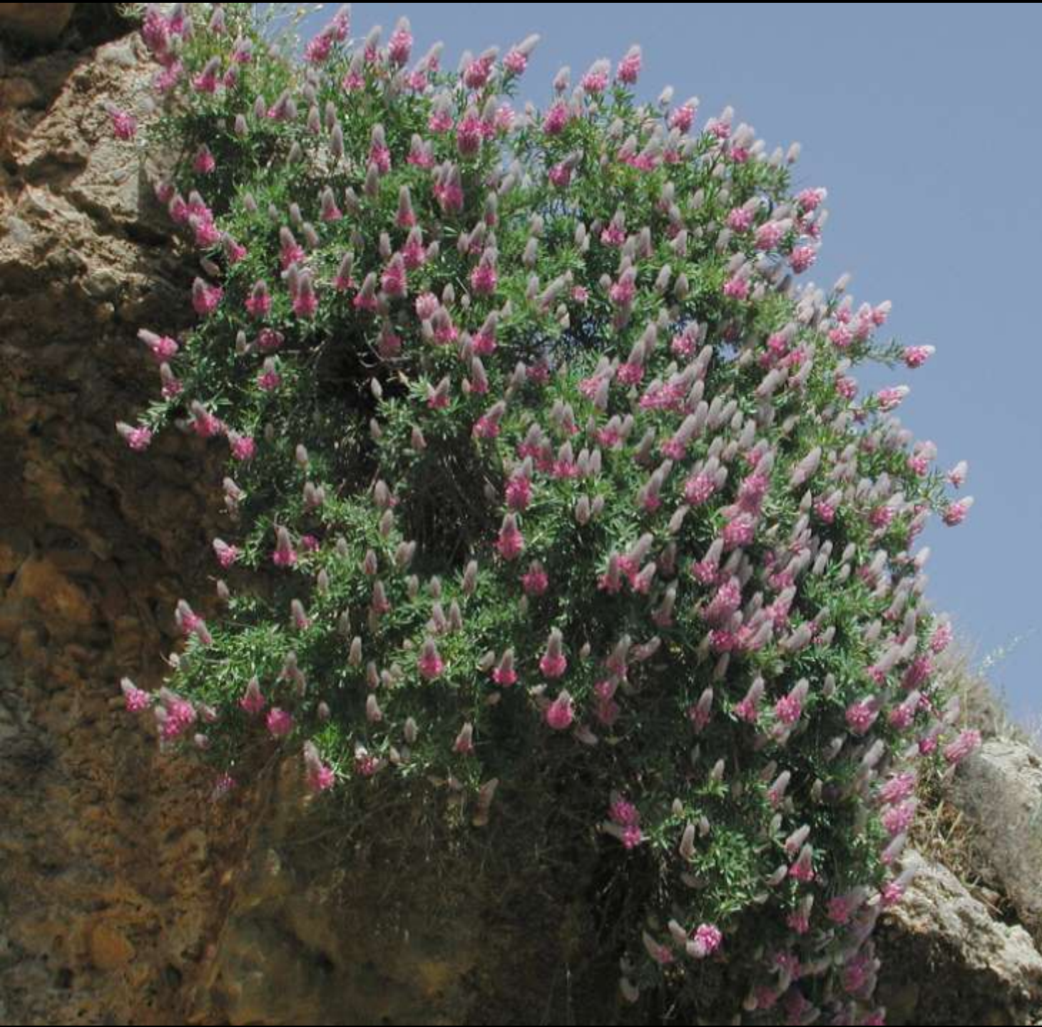
Ebenus cretica L. κ. αρχοντόξυλο