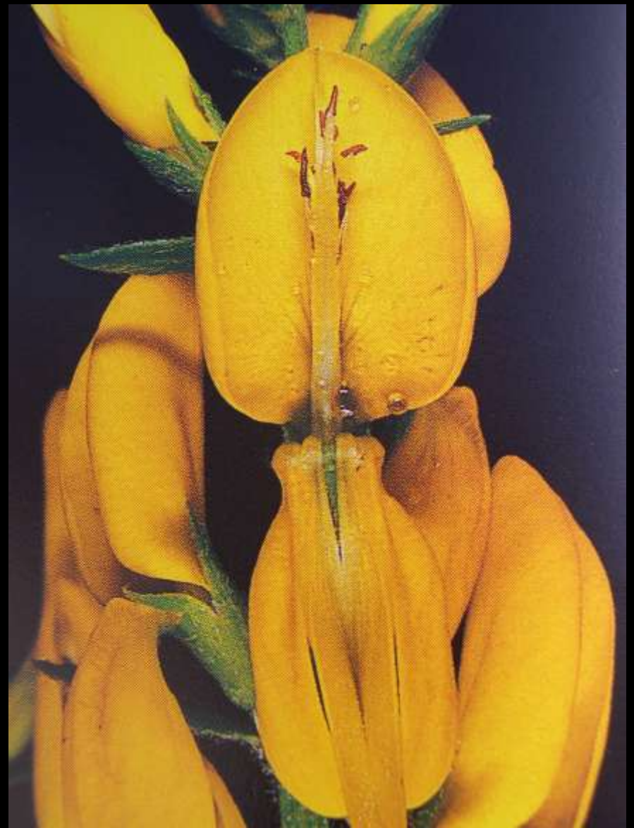
Genista tinctoria L. Γενίστα η βαφική