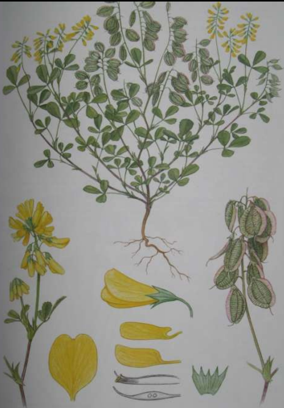
Melilotus graecus (Boiss. & Spruner) Lassen