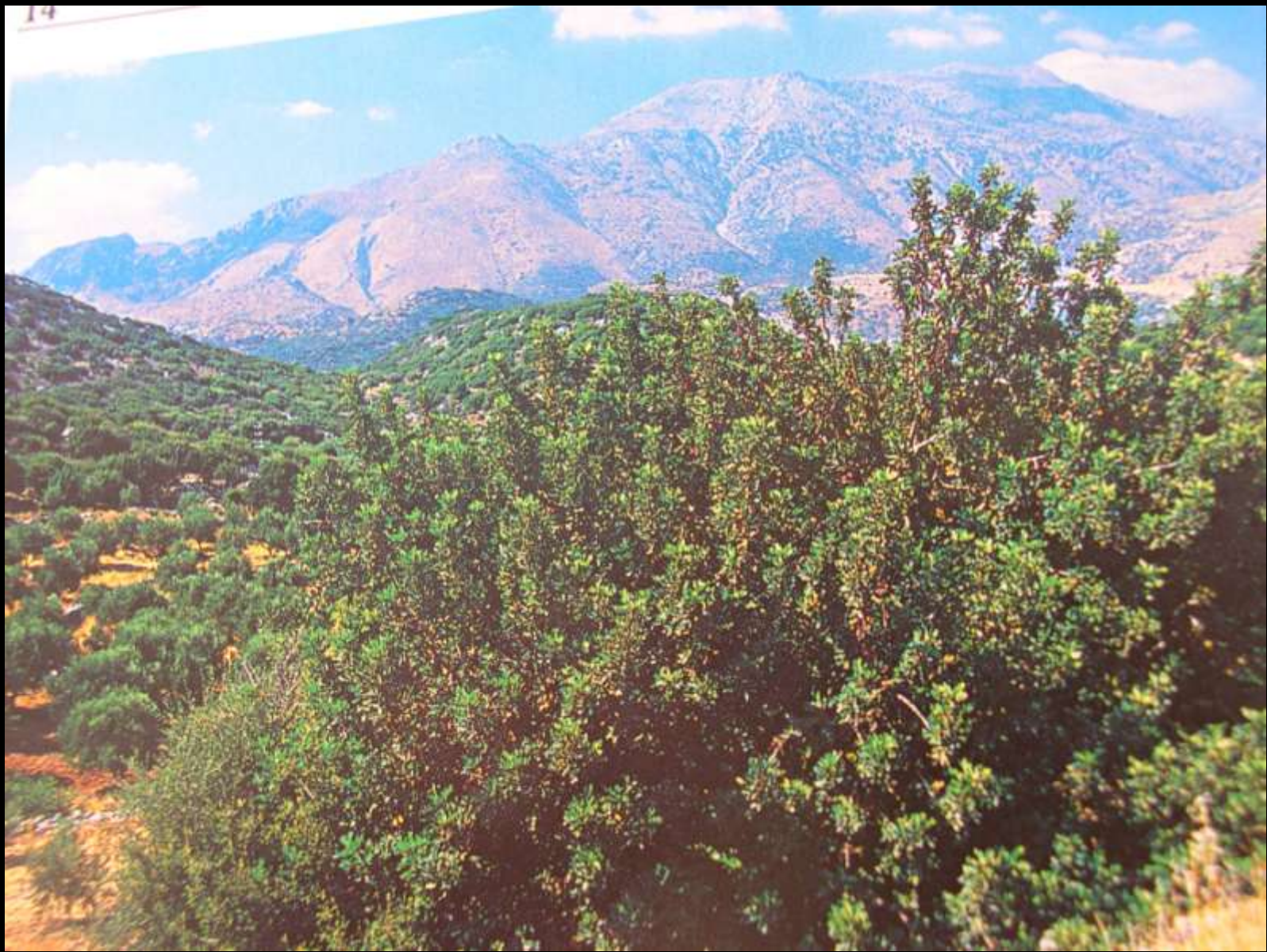
Ceratonia siliqua L. κ. χαρουπιά ή ξυλοκερατιά