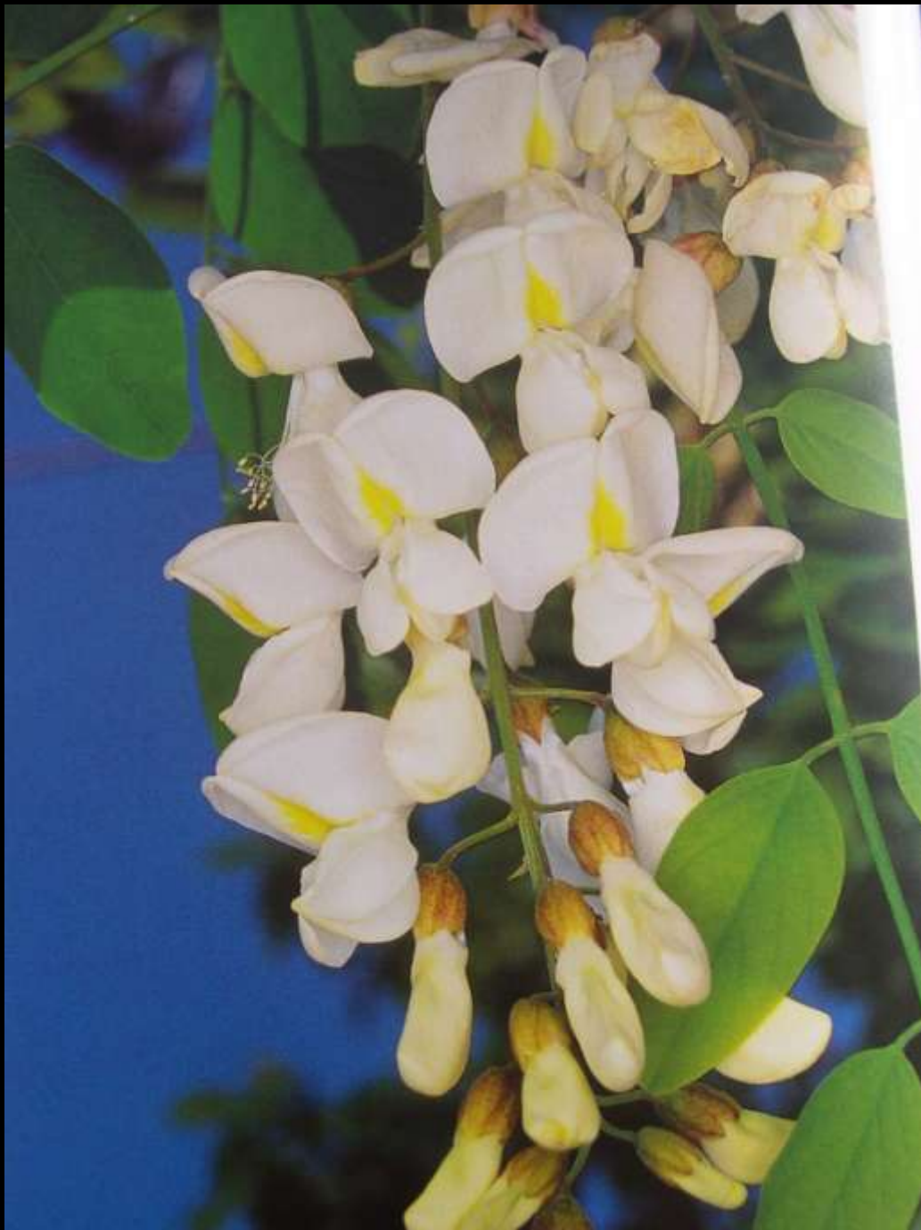
Robinia pseudacacia L. κ. ψευδακακία