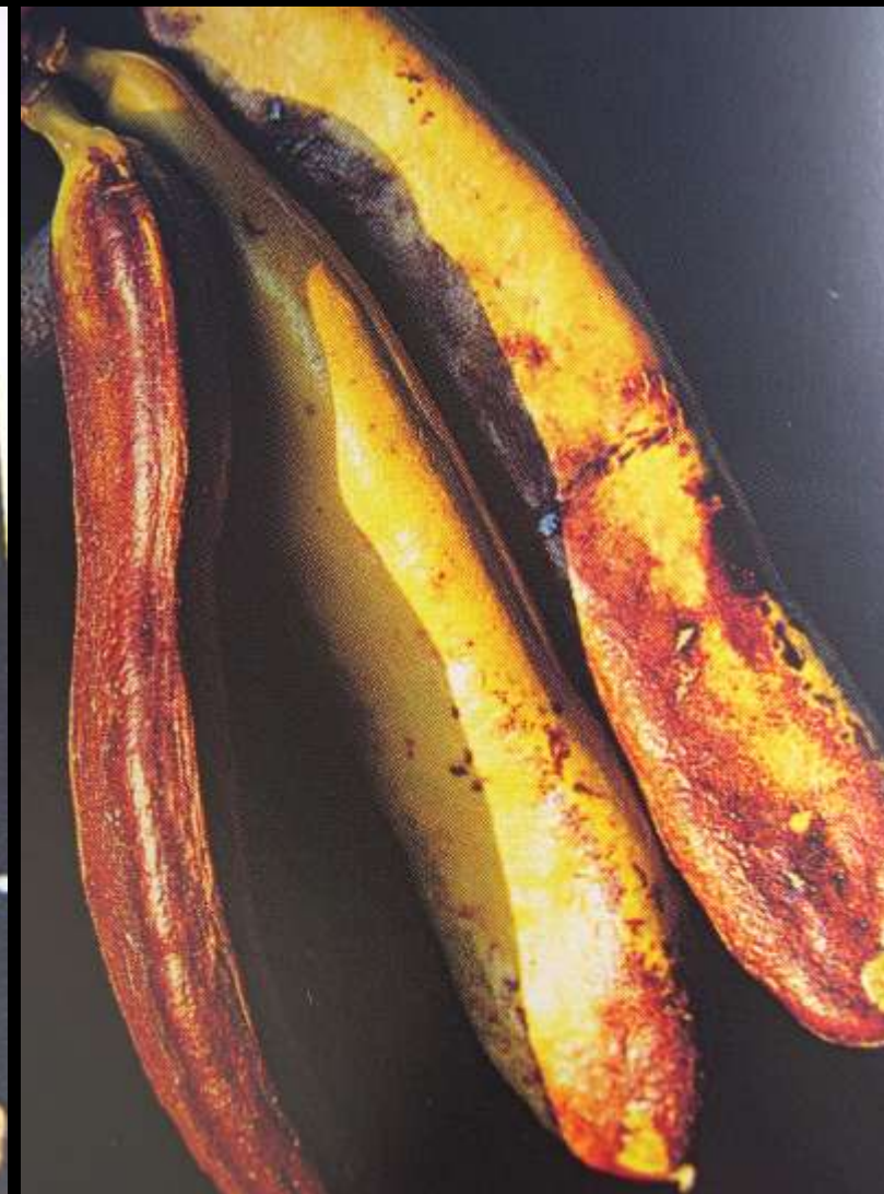
Ceratonia siliqua L. κ. χαρουπιά ή ξυλοκερατιά