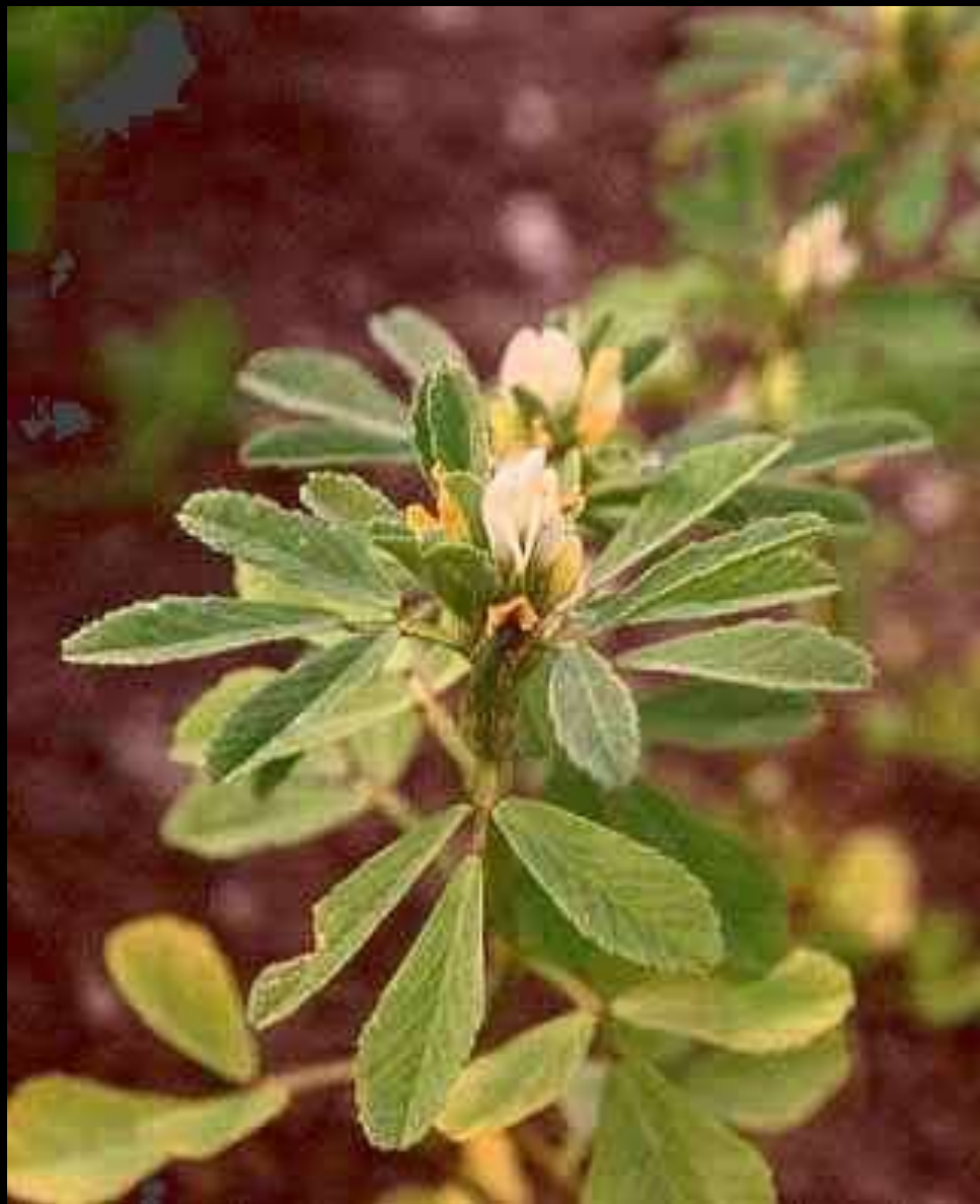
Trigonella foenum-graecum κ. τσιμένη