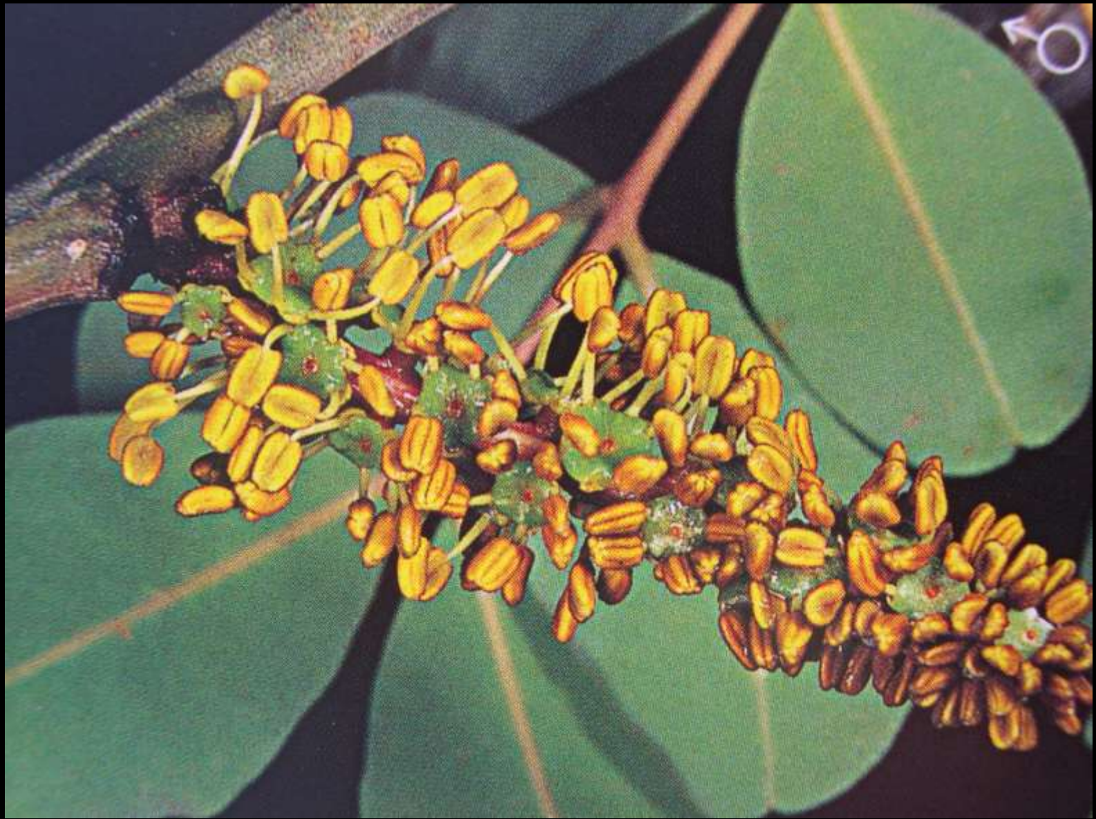
Ceratonia siliqua L. κ. χαρουπιά ή ξυλοκερατιά