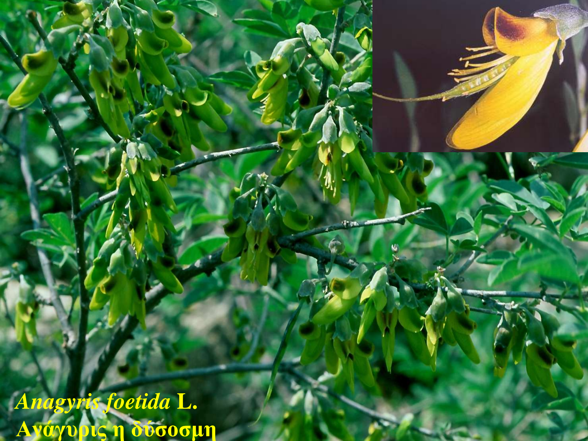
Anagyris foetida L. Ανάγυρις η δύσοσμη