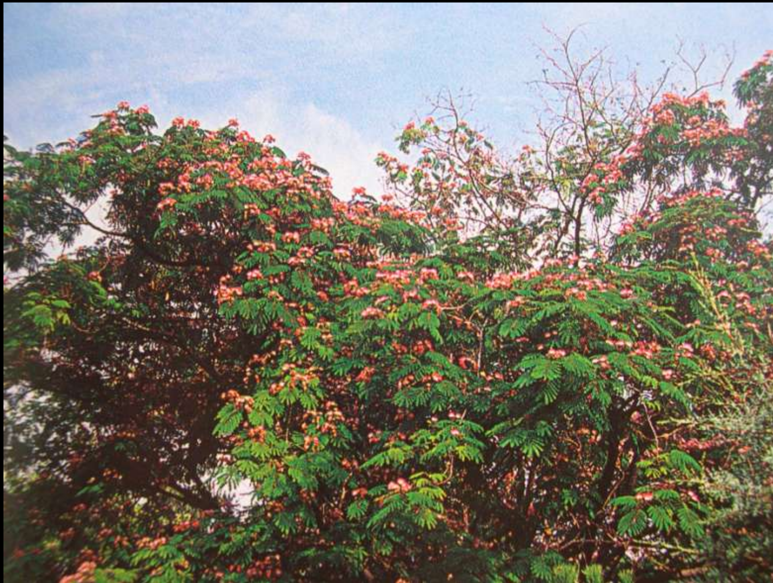
Albizia julibrissin Durazzini κ. ακακία Κωνσταντινουπόλεως