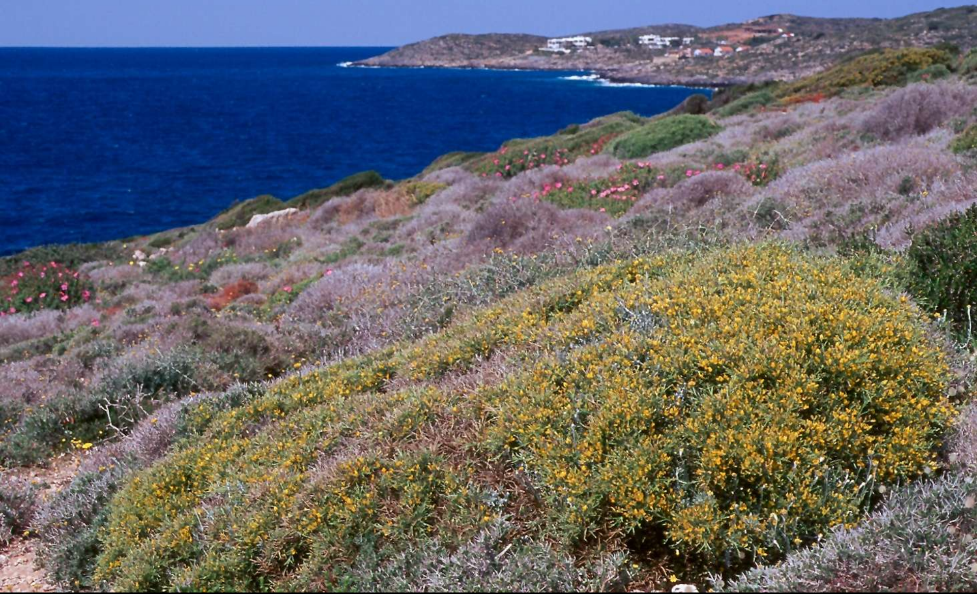
Genista acanthoclada DC. κ. αφάνα ή αχινόποδι