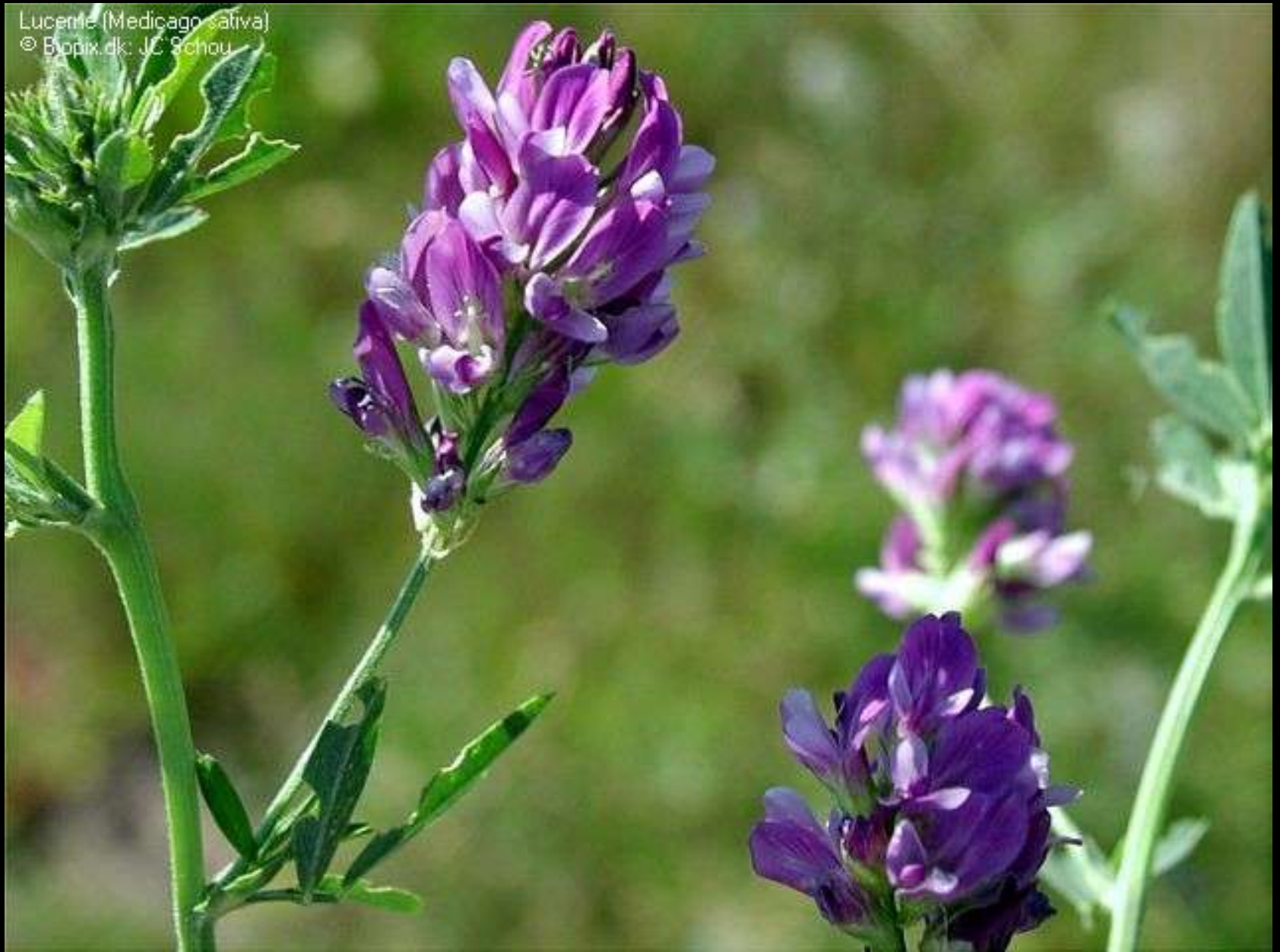
Medicago sativa L.

Lucerne (Medicago sativa)