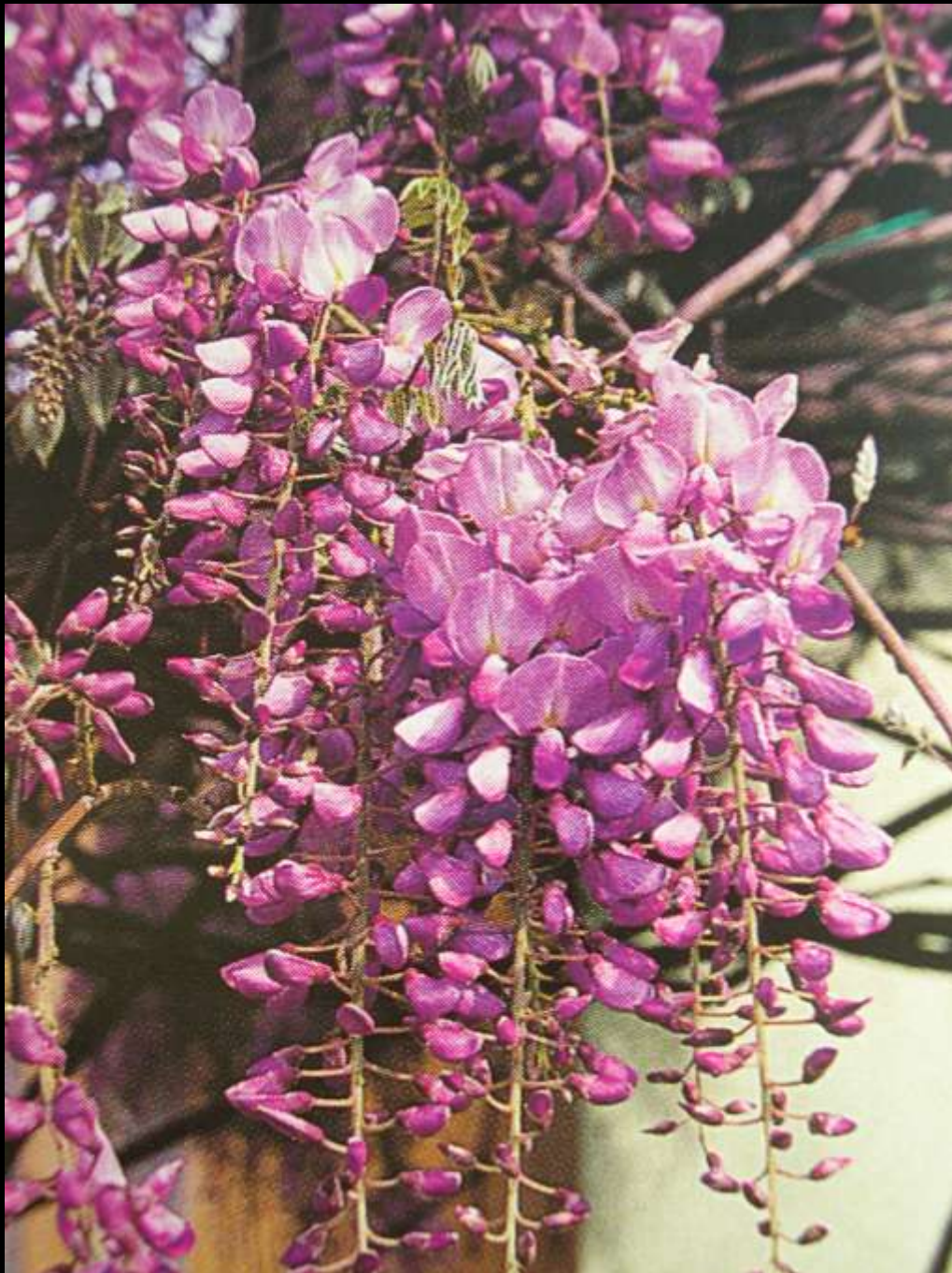
Wisteria sinensis (Sims) Sweet κ. γλυτσίνη ή πασχαλιά