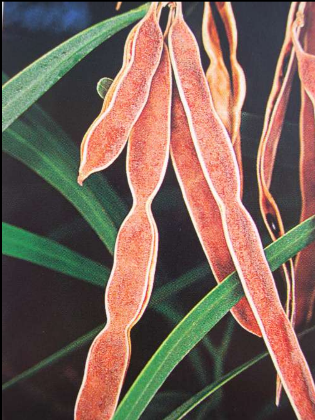
Acacia cyanophylla Labill. Ακακία η κυανόφυλλη