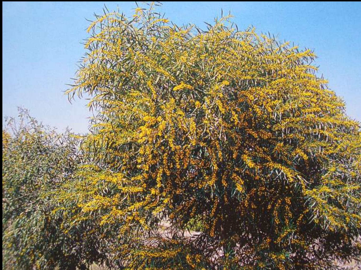
Acacia cyanophylla Labill. Ακακία η κυανόφυλλη