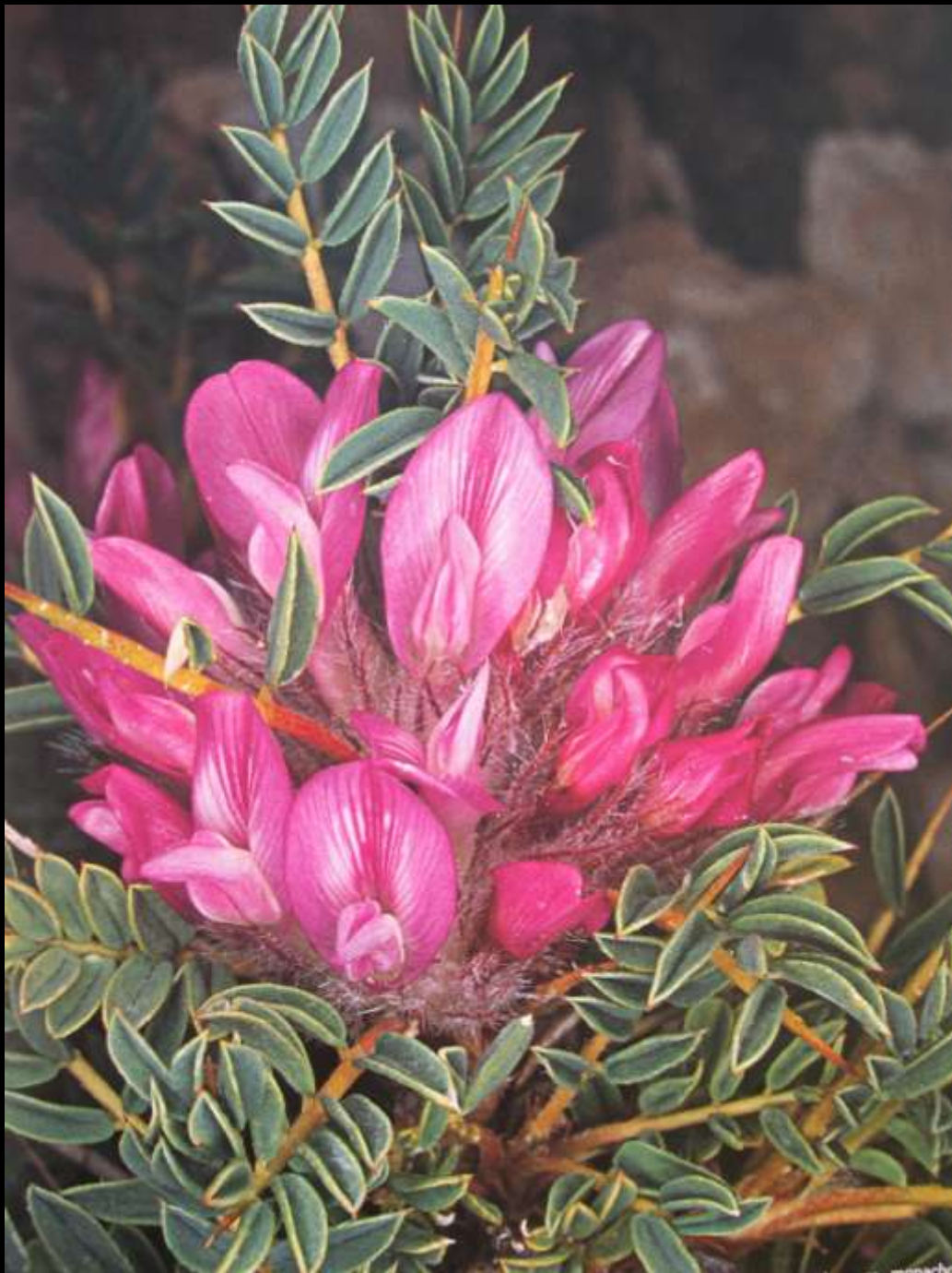
Astragalus thracicus Griseb. subsp. monachorum (Sirj.) Strid