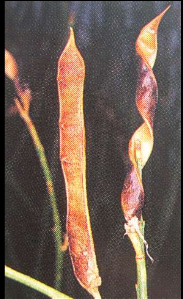
Spartium junceum L. κ. σπάρτο