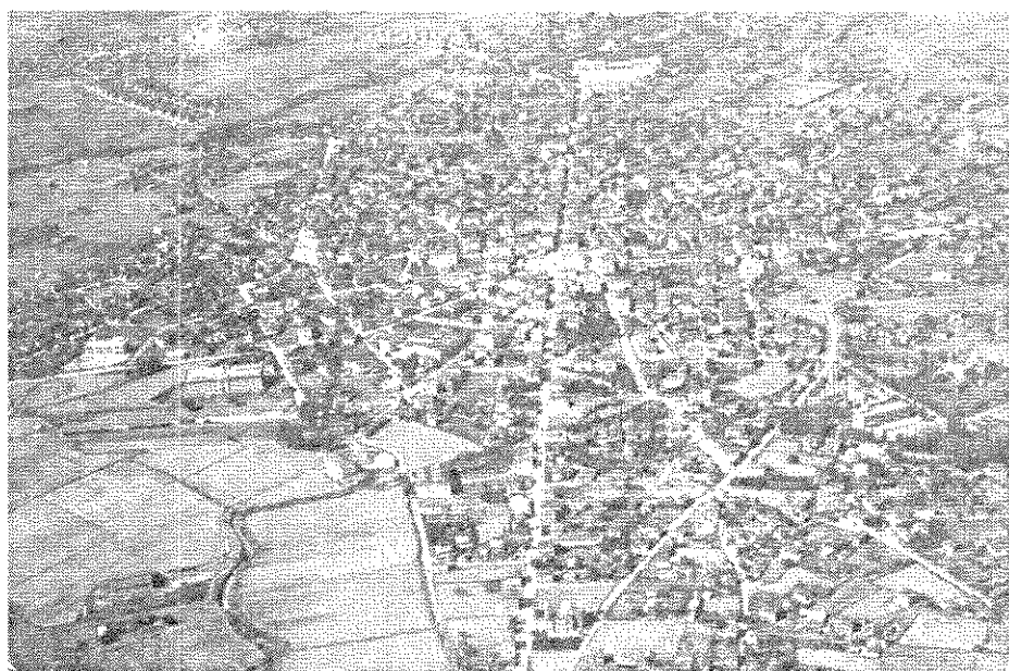
Εικ. 1. Αεροφωτογραφία του Αγρινίου στο μεσοπόλεμο. Φαίνονται οι προσφυγικοί συνοικισμοί στα βορειοδυτικά της πόλης.