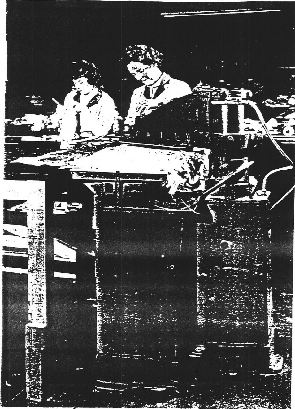
Εργαστήριο πλεκτοβιομηχανίας, Λονδίνο 1970