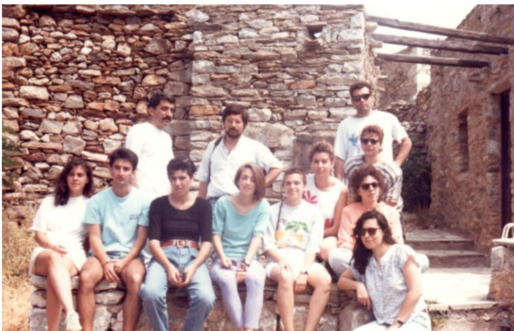
1990, Εκπαιδευτική Επίσκεψη στην Βάθεια Λακωνίας