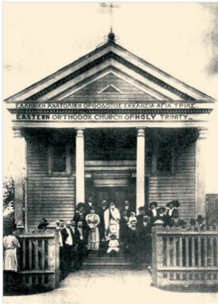
Η πρώτη Ελληνορθόδοξη εκκλησία στην Νέα Ορλεάνη 1864 , Αμερική .