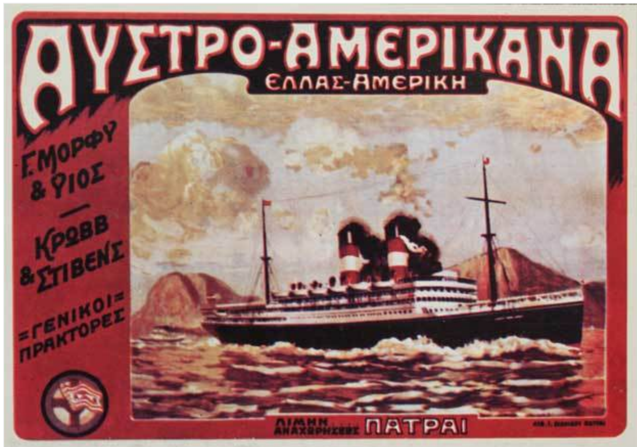
Διαφήμιση πρακτόρων για ταξίδι στην Αμερική.