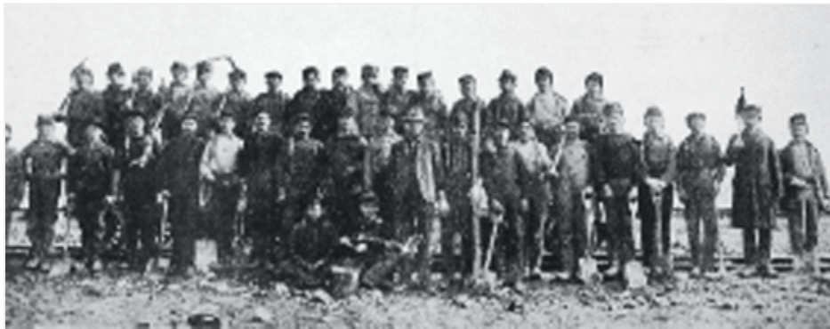
Έλληνες στους σιδηρόδρομους.