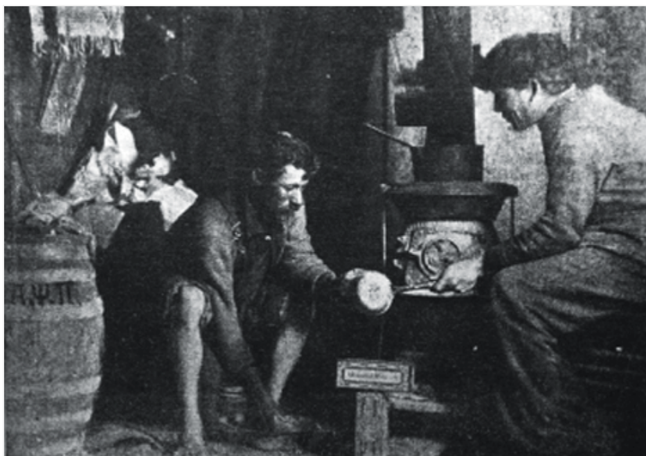
Έλληνες να μαγειρεύουν.