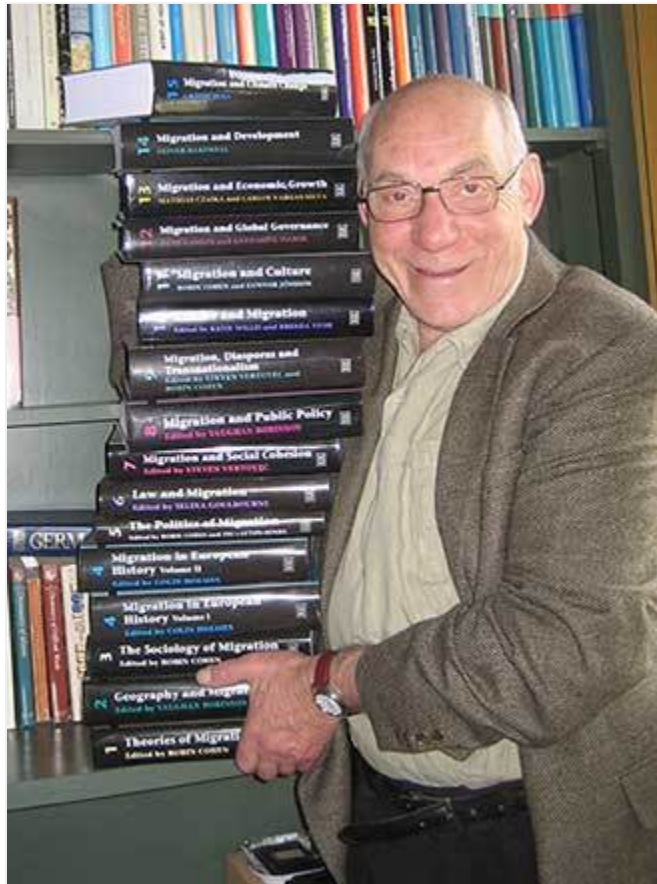
(Robin Cohen) [ Permalink ]

Ο Robin Cohen γεννήθηκε το 1944 στο Γιοχάνεσμπουργκ και είναι ομότιμος καθηγητής Αναπτυξιακών Μελετών και πρώην διευθυντής του Διεθνούς Ινστιτούτου Μετανάστευσης του Πανεπιστημίου της Οξφόρδης (Oxford). Ήταν καθηγητής της Κοινωνιολογίας στο Πανεπιστήμιο Γουόρικ (Warwick) για πολλά χρόνια και διατηρεί επίτιμη θέση αξιώματος καθηγητή στο εν λόγω Πανεπιστήμιο. Υπηρέτησε ως κοσμήτορας Ανθρωπιστικών Επιστημών του Πανεπιστημίου του Κέιπ Τάουν (Cape Town, 2001-3) και σε εθνικό επίπεδο συντόνισε το Βρετανικό Κέντρο Έρευνας Εθνοτικών Σχέσεων στο Γουόρικ (Warwick, 1985-9). Είχε, επίσης, πραγματοποιήσει συναντήσεις (πλήρες ωράριο) με τα Πανεπιστήμια Ιμπατάν (Ibadan), Μπέρμιγχαμ (Birmingham), Δυτικών Ινδιών (West Indies), Στάνφορντ (Stanford), Τορόντο (Toronto) και Μπέρκλεϊ (Berkeley).