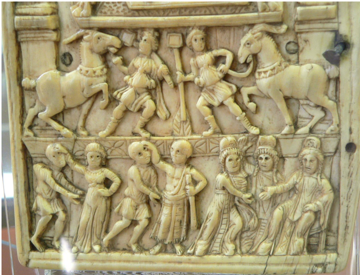
Λεπτομέρεια από το δίπτυχο του υπάτου Αναστασίου (516 ή 517): Μίμοι (αριστερά) και τραγικοί ηθοποιοί(;) (δεξιά).