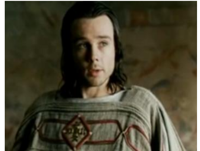
Ο Συνέσιος Κυρήνης στο Agora του A. Amenábar (2009)