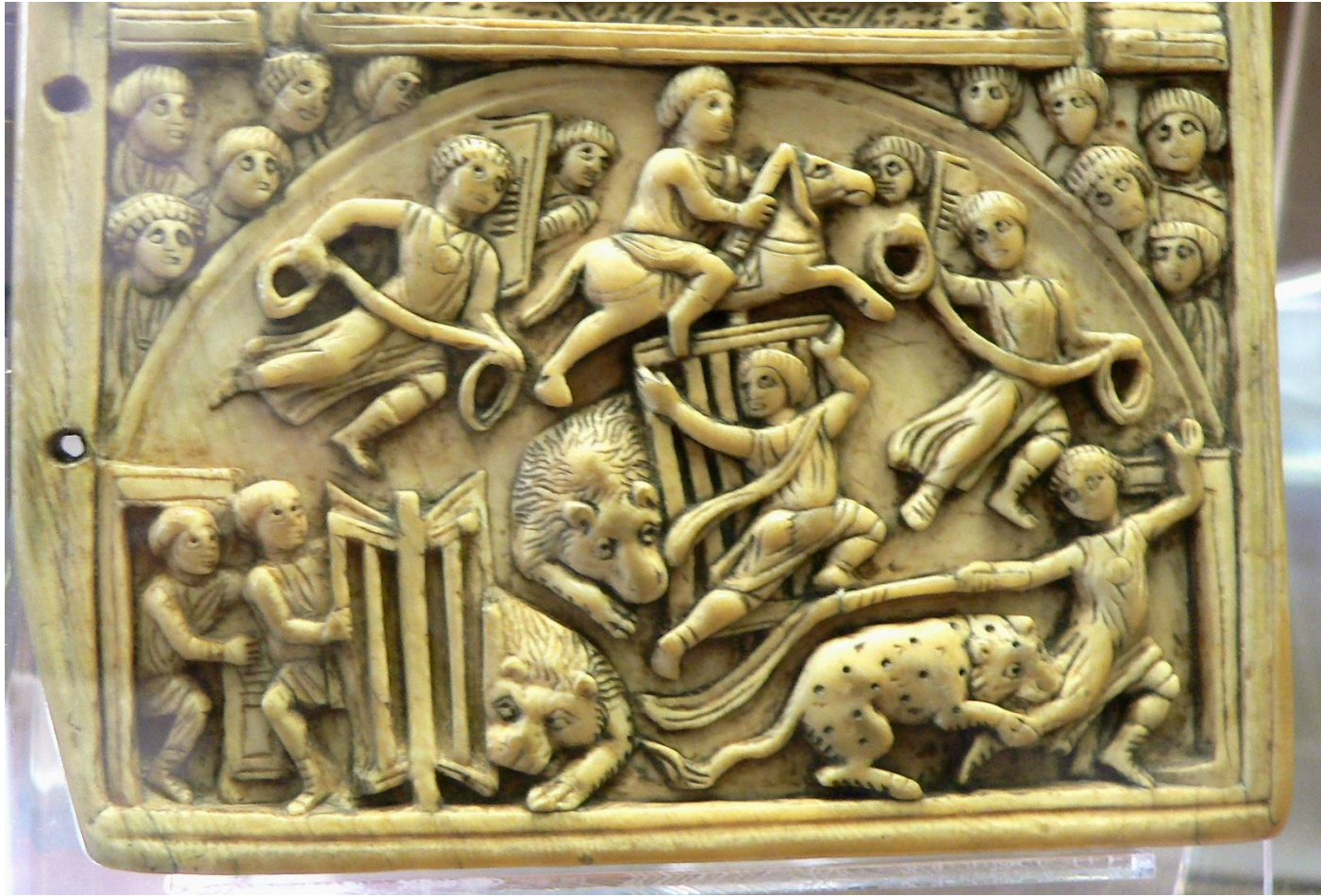
Λεπτομέρεια από το δίπτυχο του υπάτου Αναστασίου (516 ή 517): Κυνήγιον .