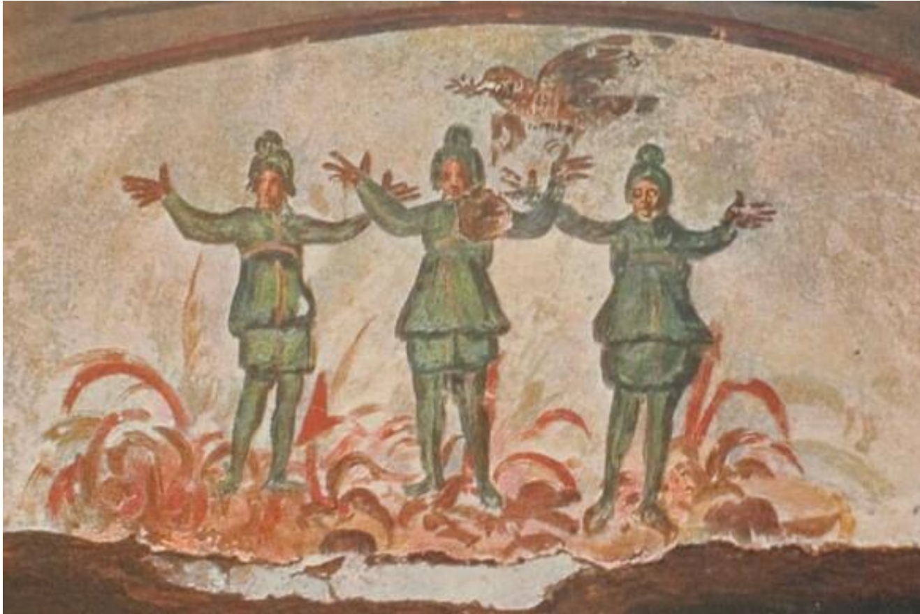
Κατακόμβη της Πρίσκιλλας, Ρώμη (περ. 300 μ. Χ.)