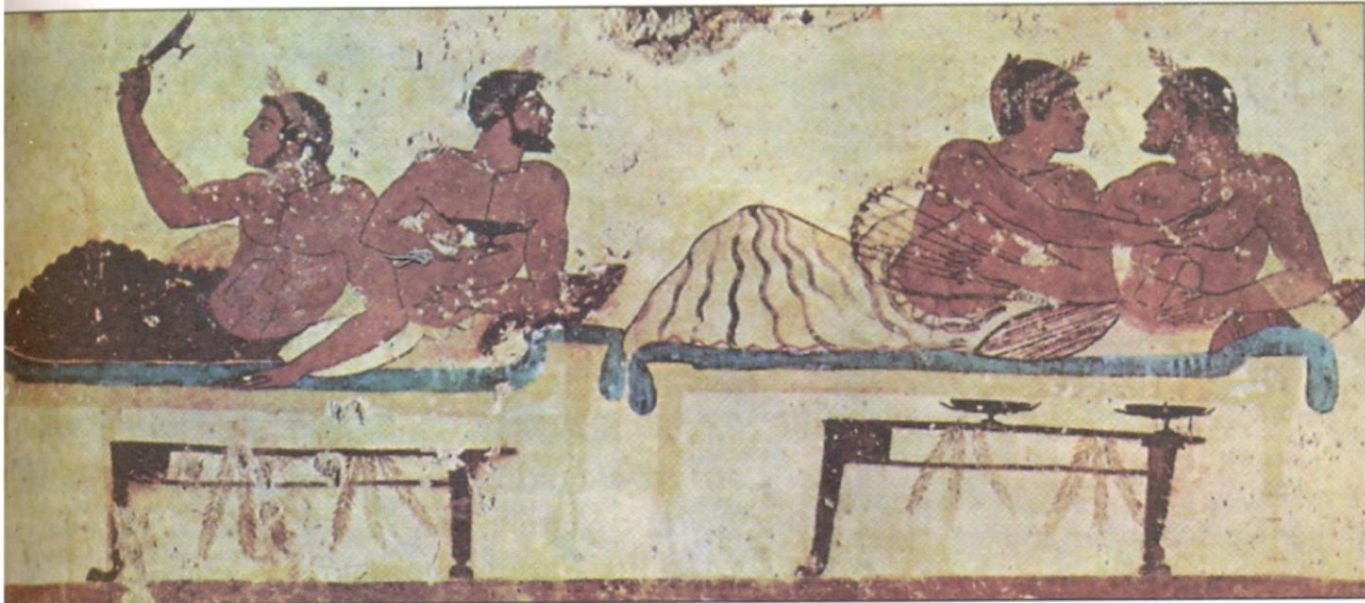
Τοιχογραφία από τάφο της Ποσειδωνίας. Σκηνή συμποσίου. Αντιπροσωπευτικό έργο της ελληνικής ζωγραφικής των κλασικών χρόνων. (Μουσείο Paestum)