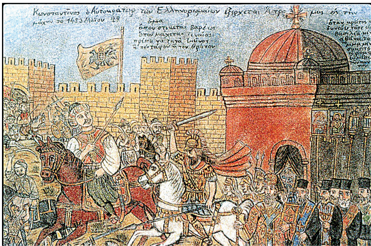
Η προσπάθεια του Παλαιολόγου το 1439 να ενωθούν η δυτική με την ανατολική εκκλησία βρήκε την αντίσταση των «ανθωνωτικών», ένας εκ των οποίων, ο Σχολάριος, έγινε ο πρώτος Πατριάρχης Κωνσταντινουπόλεως μετά την κατάκτηση από τους Οθωμανούς

SMS > Η Ελληνική Επανάσταση επανέφερε τους μύθους του μαρμαρωμένου Βασιλιά και της ανάκτησης της Πόλης. Όμως μεγαλύτερο ρόλο, χάρη στους Φιλέλληνες, έπαιξαν οι αρχαίοι ημών πρόγονοι και η ανάσταση της αρχαιότητας.