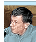
Του ΠΑΡΗ ΚΟΝΟΡΤΑ*

ΩΣΤΟΣΟ , αν και η Αυτοκρατορία έπαψε να υπάρχει, ο Βυζαντινός κόσμος και γενικότερα μεγάλο μέρος των ορθόδοξων πληθυσμών συνέχισαν να ζουν κάτω από την οθωμανική εξουσία. Ο θεσμός που, τουλάχιστον κατά τους πρώτους μετά την Αλωση αιώνες, μπορούσε να μεταλαμπαδεύσει τις αξίες της ορθόδοξης κοινωνίας στην νέα πραγματικότητα που καθόριζε η οθωμανική τάξη πραγμάτων, ήταν η Ορθόδοξη Εκκλησία και ιδιαίτερα το Πατριαρχείο Κωνσταντινουπόλεως. Πράγματι, μετά την εξαφάνιση του Βυζαντινού Αυτοκράτορα από το προσκήνιο, η Εκκλησία απέκτησε περισσότερες αρμοδιότητες από αυτές που είχε κατά τη βυζαντινή περίοδο. Τα μέλη του Ανώτατου Ορθόδοξου Κλήρου ήταν και νομοθέτες και δικαστές για συγκεκριμένα ζητήματα, ήταν οι μόνοι που μπορούσαν να παράσχουν εκπαίδευση και άρα να περάσουν συστήματα αξιών στις επόμενες γενιές των Ορθόδοξων ασκώντας φυσικά και ιδεολογική καθοδήγηση.