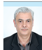
Του ΓΙΑΝΝΗ ΠΑΠΑΘΕΟΔΩΡΟΥ*

« ΓΙΑΤ' ΕΙΝΑΙ ΘΕΛΗΜΑ Θεού η Πόλη να τουρκέψη». Ο στίχος ανήκει στον πιο διαδεδομένο «θρήνο» για την άλωση της Κωνσταντινούπολης. Η σύγχρονη έρευνα έχει δείξει πως τόσο η παλαιότητα του θρήνου όσο και η αυθεντικότητα του στίχου είναι αμφίβολη. Οι προσθαφαιρέσεις στίχων σε όλες τις παραλλαγές του θρήνου είναι άλλωστε συχνές και γνωστές, ήδη από την εποχή του Φοριέλ, στον οποίο χρωστάμε την «ανακάλυψη» των δημοτικών τραγουδιών. Σήμερα, γνωρίζουμε ότι ο στίχος «προστέθηκε» από τον Σπ. Ζαμπέλιο, τον 19ο αιώνα. Η δημοτικοφανής «μίμηση» και η προσθήκη του στίχου από τον Ζαμπέλιο γνώρισε πάντως μεγάλη επιτυχία και αποδοχή. Ετσι, ο μύθος ενίσχυσε την ιδεολογική χρήση της ιστορίας. Ο θρήνος «της Αγία-Σοφιάς», όπως έλεγε ο Ν. Γ. Πολίτης στις πρώτες δεκαετίες του 20ού αιώνα, έμοιαζε να έχει συνταχθεί «ευθύς μετά την καταστροφή» και να αντανάκλα «με βαθειά απλότητα συναίσθημα εγκαρτερήσεως προς τα μεγάλα εθνικά δεινά και βεβαίαν την ελπίδα του δουλωθέντος γένους περί ελευθερίας και ανορθώσεως».