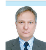
Του ΚΩΝΣΤΑΝΤΙΝΟΥ ΚΟΛΙΟΠΟΥΛΟΥ*

μη και μετά την ανάκτηση της Κωνσταντινούπολης το 1261. Αυτό επέτρεψε στους Τούρκους να κατακτήσουν και την υπόλοιπη Μ. Ασία τον 13ο-14ο αιώνα. Η τουρκική κατάκτηση συνοδευόταν από σταδιακό εξισλαμισμό των κατοίκων. Την εποχή της Αλώσης η σχετική διαδικασία είχε ολοκληρωθεί και πλέον η Μ. Ασία είχε μετατραπεί από ελληνοχριστιανική σε τουρκοϊσλαμική – όπως και παραμένει. Η Αλώση συμβολίζει αυτό το γεγονός.