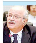
Του ΘΑΝΟΥ ΒΕΡΕΜΗ*

Η Αλωση της Κωνσταντινούπολης δεν υπήρξε το πραγματικό τέλος του Βυζαντίου, που είχε καταρρεύσει ήδη από τον 13ο αιώνα. Η αρχή του τέλους ήταν η 4η Σταυροφορία, όταν η Πόλη έπεσε στα χέρια των Φράγκων και των Ενετών και λεηλατήθηκε. Εξίσου πέρασαν στα χέρια των κατακτητών η Πελοπόννησος και η κυρίως Ελλάδα. Η προσπάθεια του Παλαιολόγου το 1439 να ενωθούν η δυτική με την ανατολική εκκλησία βρήκε την αντίσταση των «ανθενωτικών», ένας εκ των οποίων, ο Σχολάριος, έγινε ο πρώτος Πατριάρχης Κωνσταντινουπόλεως μετά την κατάκτηση από τους Οθωμανούς.