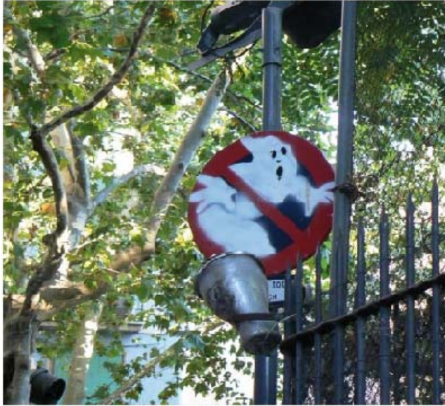
Παραποίηση σημάτων δρόμου