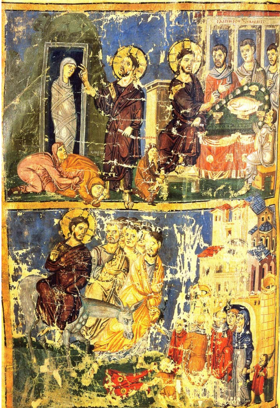
Παρίσι, Nationale Bibliotheque, Ομιλίες Γρηγορίου Ναζιανζηνού, σκηνές από τη ζωή του Χριστού, 879-883.