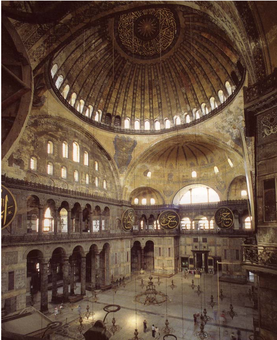
Κωνσταντινούπολη, Αγ. Σοφία, βόρειο τύμπανο, πατριάρχης Ιγνάτιος, τέλη 9 ου αι.