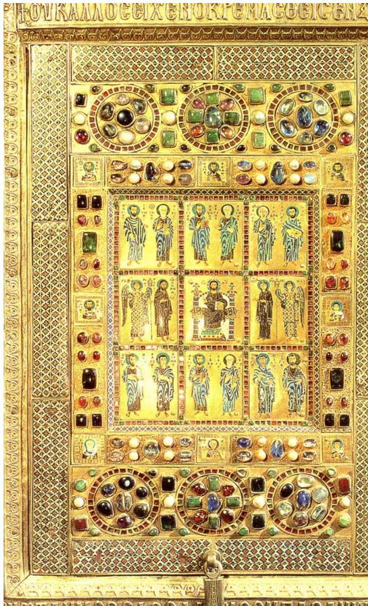
Λίμπουργκ, Μουσείο Diocesan, Σταυροθήκη, 945-959.