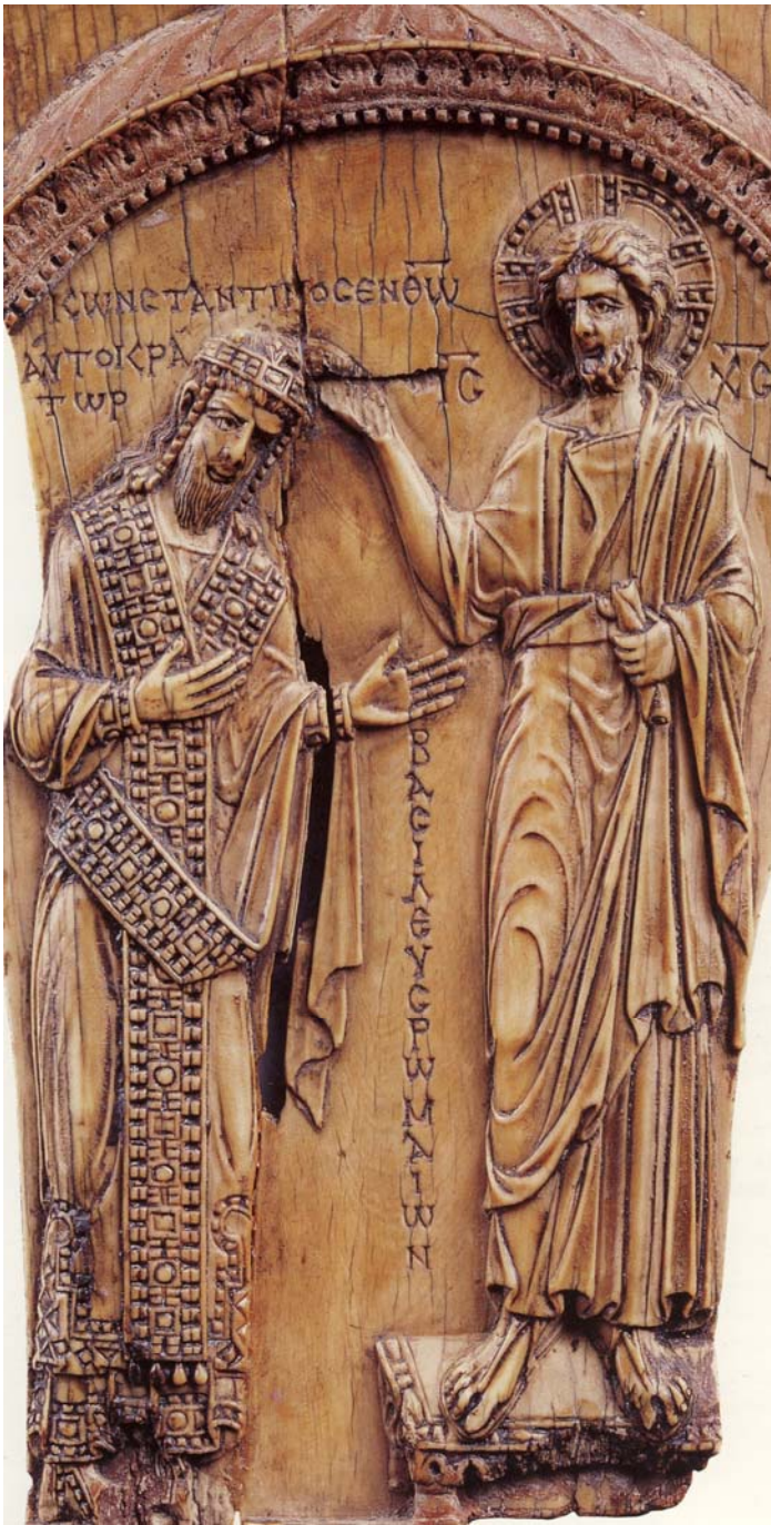
Μόσχα, Κρατικό Μουσείο Πούσκιν. Ο Χριστός στεφανώνει τον αυτοκράτορα Κωνσταντίνο Ζ', 913.