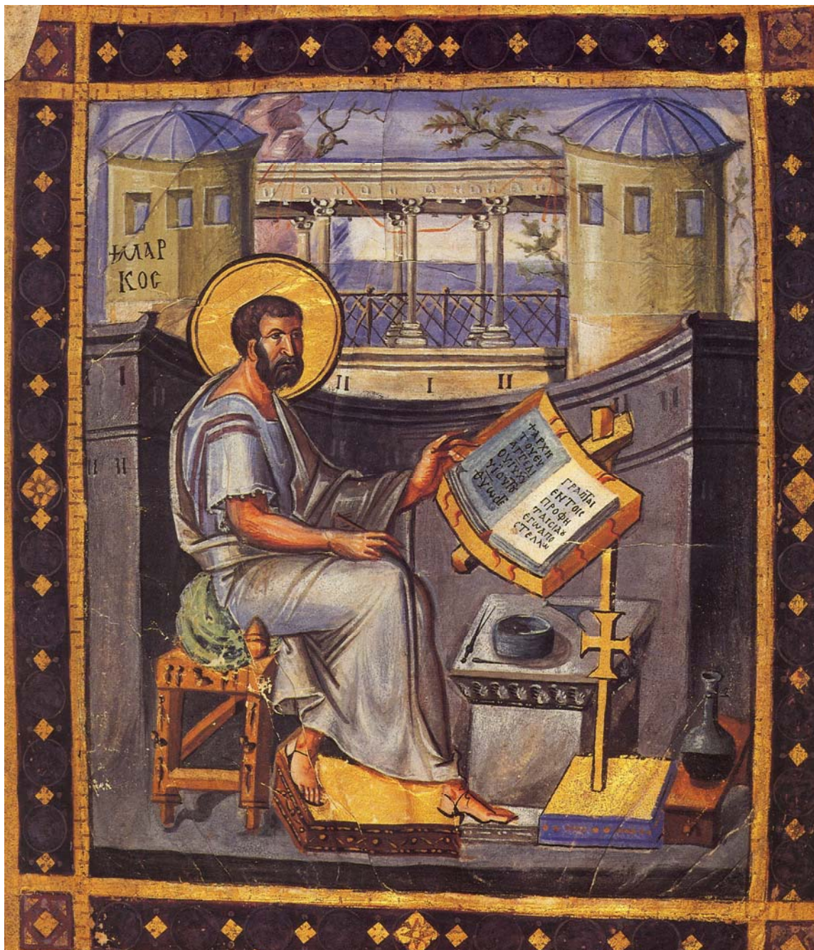
Άγιον Όρος, Μ. Σταυρονικήτα, κώδ. 43, περί το 950.