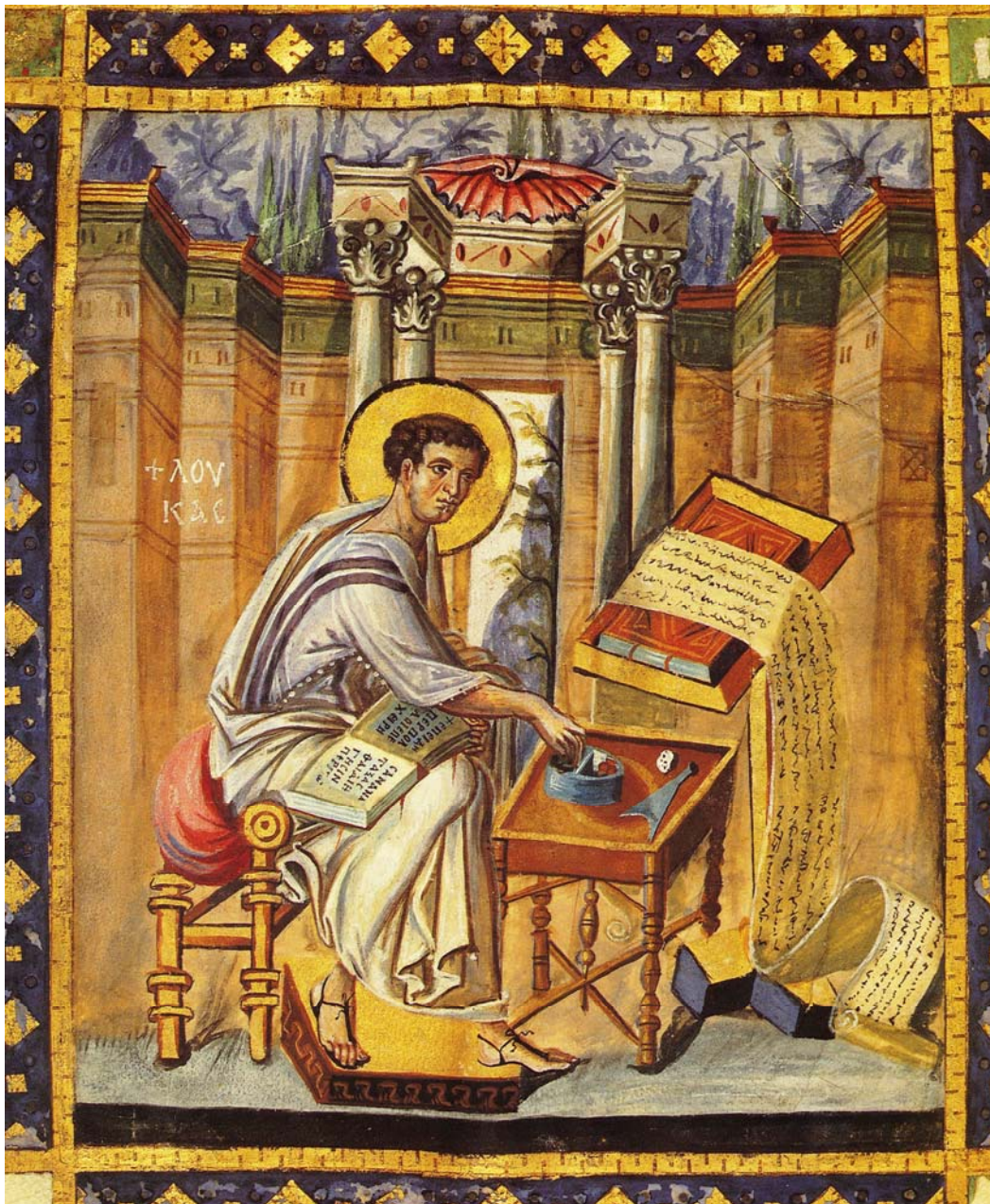
Μονή Σταυρονικήτα, κώδ. 43. Ευαγγελιστής Λουκάς, περί το 950.