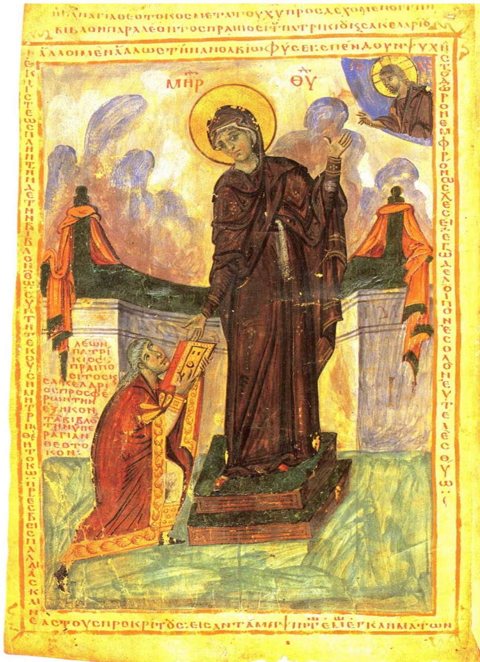
Ρώμη, Βιβλιοθήκη Βατικανού, Βίβλος Λέοντα, περί το 930-940.