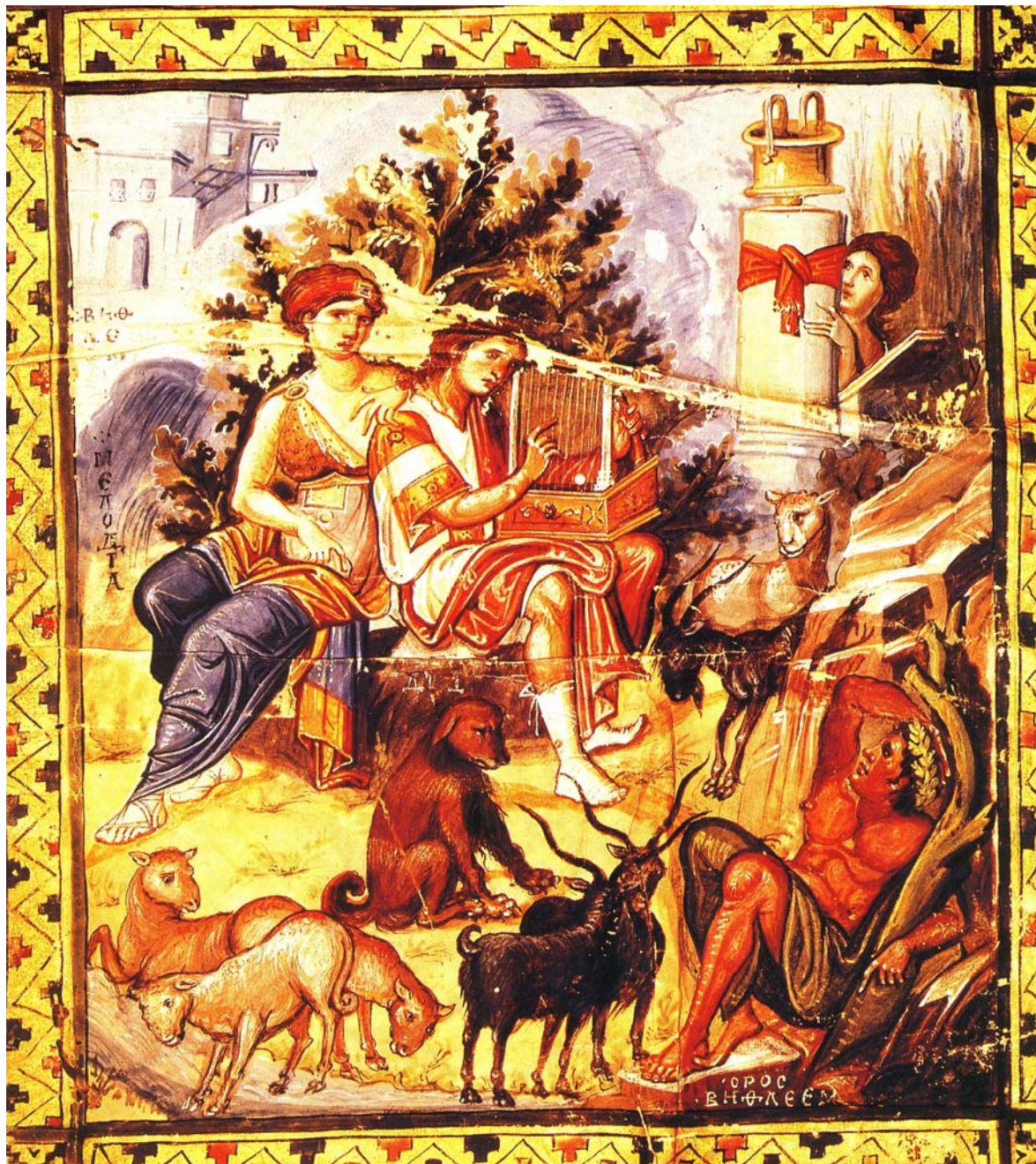
Παρίσι, Ψαλτήριο κώδ. gr.139. Ο Δαβίδ με τη Μελωδία.