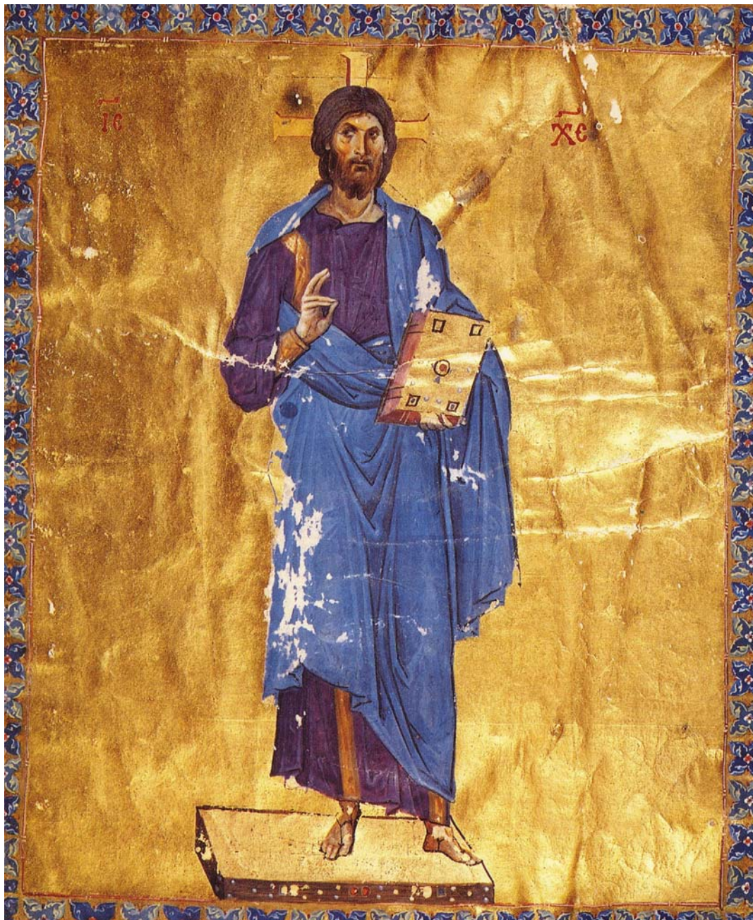
Σινά, Μονή Αγ. Αικατερίνης, Ευαγγελιστάριο, κώδ. 204, τέλος 10 ου αι.