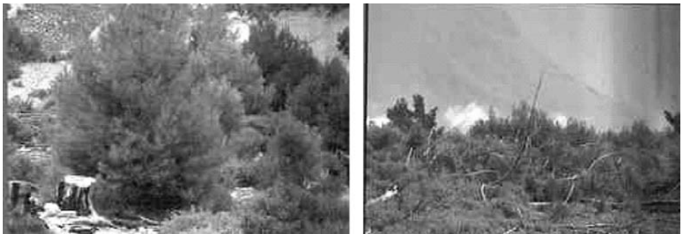
Εικόνα 1. Φυσική αναγέννηση τραχείας στη Θάσο, δέκα χρόνια μετά τη φωτιά όπου έγιναν υλοτομίες (A), Φυσική αναγέννηση τραχείας στη Ρόδο, δέκα χρόνια μετά τη φωτιά όπου δεν έγιναν υλοτομίες (B).