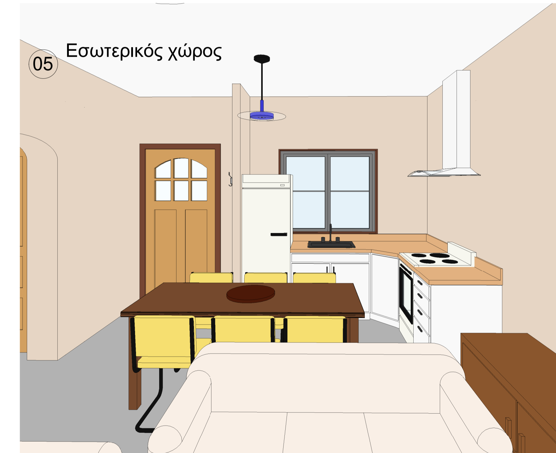
05 Εσωτερικός χώρος