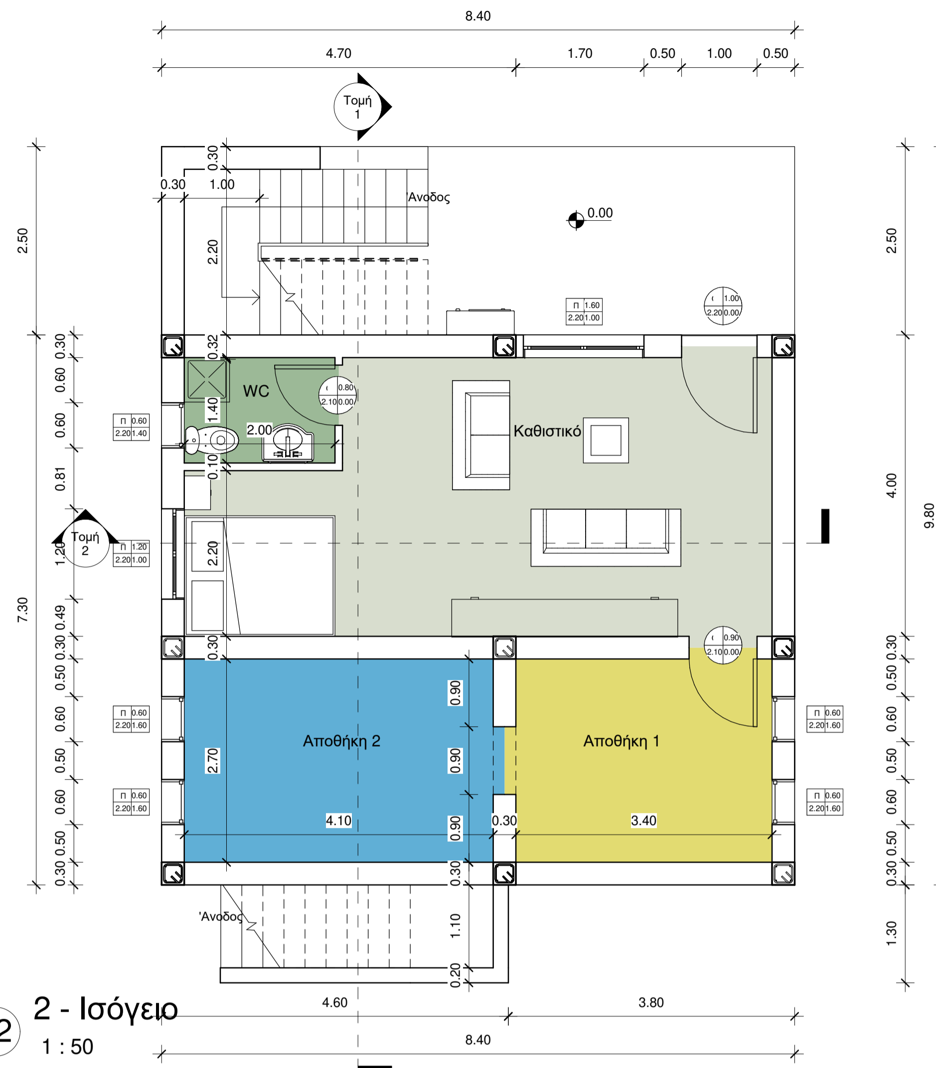
02 2 - Ισόγειο 1 : 50