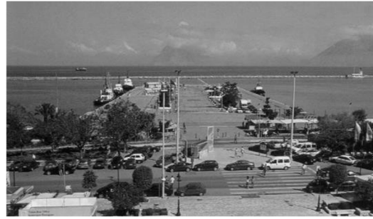
Το λιμάνι και ο κεντρικός Μόλος Αγ. Νικολάου (παλαιότερα και σήμερα)