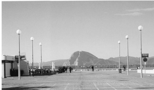
Ο φάρος στο Μόλο του Αγ. Νικολάου (τώρα κατεδαφισμένος) και ο Μόλος σήμερα. Αντίκρυ, στην απόληξη του άξονα του Μόλου, η Παλαιιοβούνα στην ακτογραμμή της Στερεάς Ελλάδας, τοπιακό σημείο αναφοράς. Μεσολαβεί το γραμμικό στοιχείο του κυματοθραύστη.