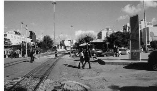
Η οδός Όθωνος-Αμαλίας στην Πλατεία Τριών Συμμάχων (παλαιότερα και σήμερα)