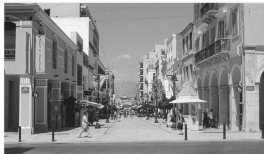
Η οδός Αγ. Νικολάου και οι στοές στη συμβολή με την οδό Μαιζώνος (παλαιότερα και σήμερα)