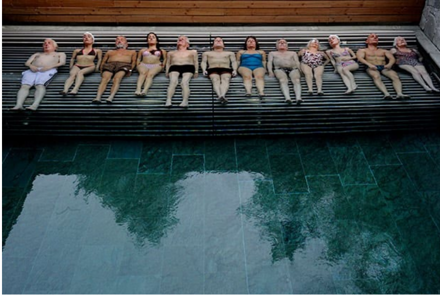
Εικόνα 2: Paolo Sorrentino, Youth , 2015