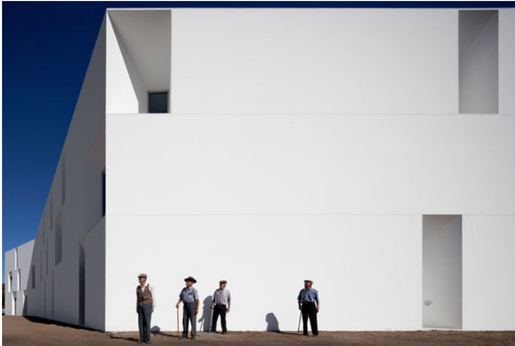
Εικόνα 1: Fernando Guerra, Το κτήριο φροντίδας ηλικιωμένων από τους αρχιτέκτονες Aires Mateus, Alcácer do Sal (Portugal), 2010

Μια κυρτωμένη πλάτη και ένα μπαστούνι είναι ένα δομικό πρόβλημα πολύ πιο ενδιαφέρον προς επίλυση από ένα πρόβλημα... Η αρχιτεκτονική χρησιμοποιεί μη αναμενόμενες ιδέες για να παράγει βαθιά ποιητικές συνέπειες.